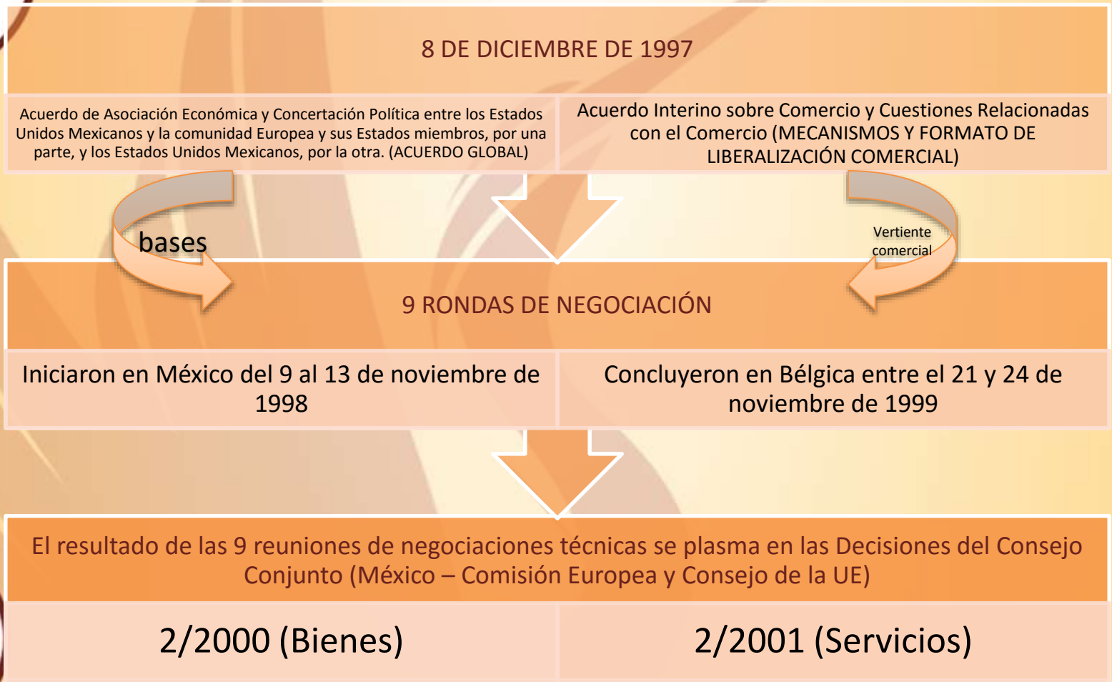
Figura 2 Celebración del TLCUE