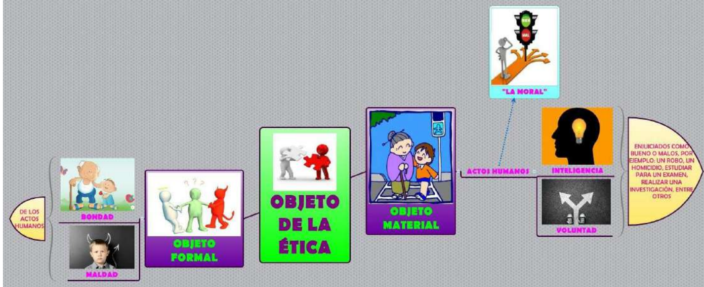
Fig. 2 Mapa Mental de los Objetos que conforman a la Ética. Elaboración propia.