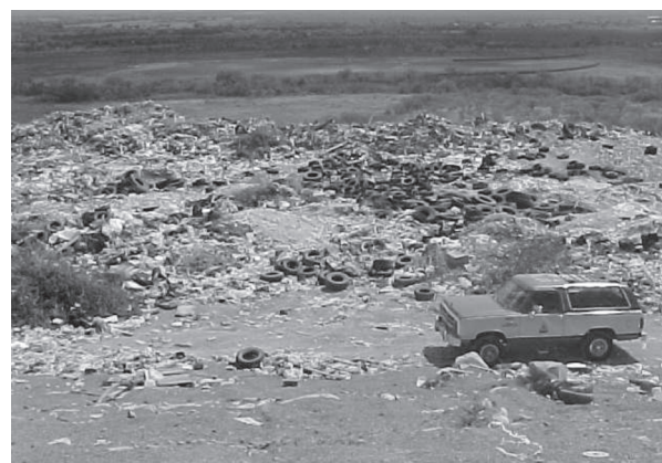
Fig. 1. Tiradero municipal.

industrial (figura 1). Los residuos fueron depositados en un lomerío en contacto directo con el macizo rocoso, compuesto por lutitas de la Formación Méndez del Cretácico superior, es una estructura geológica de tipo braquianticlinal bifurcado; carece de una geomembrana que los aisle del contacto con las aguas subterráneas.