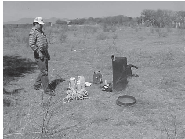
Fig. 3. Toma de muestras de agua en distintos aprovechamientos hidráulicos y análisis en campo y laboratorio.

La evaluación de la calidad del agua subterránea indica que existe contaminación por sólidos totales, sólidos suspendidos, coliformes totales, coliformes fecales, nitratos, sulfatos, mercurio y bario, que ponen en riesgo la salud del consumidor (tabla II, en anexo). Conforme al análisis de vulnerabilidad realizado, las principales fuentes de contaminación fueron en orden de importancia: el tiradero municipal, depósitos de barita, descargas de aguas residuales a través de fosas sépticas y letrinas y los residuos generados por los animales en las granjas porcícolas. Se observó que existe una relación directa entre la infiltración de los contaminantes a través de fracturas (cuya orientación principal es NE-SW) y gravas en la misma dirección del flujo del agua subterránea, es decir, principalmente hacia el NE, dirección en que se observa el crecimiento de la población.