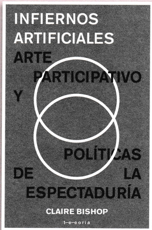
▲ Portada de la edición en español.

El texto también analiza los aportes de la Internacional Situacionista y del Groupe de Recherche d'Art Visuel (GRAV) para la participación lúdica del público en espacios urbanos. Revalora los happenings de Jean-Jacques Lebel en París, durante el inicio de la segunda mitad del siglo XX, y establece un lazo con los happenings sudamericanos en el periodo de las dictaduras, destacando el teatro invisible de Augusto Boal, integrado por obras teatrales que sucedían en espacios públicos sin que las personas supiesen que se trataba de una representación. Las obras de teatro invisible eran situaciones que detonaban la colectividad en un periodo de fuerte represión en Brasil.