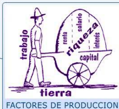
FACTORES DE PRODUCCION