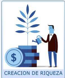
CREACION DE RIQUEZA