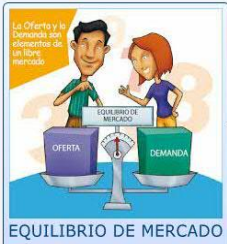
EQUILIBRIO DE MERCADO

Decisiones sobre la compra de maquinaria y equipo, capacitación de personal o construcción de plantas