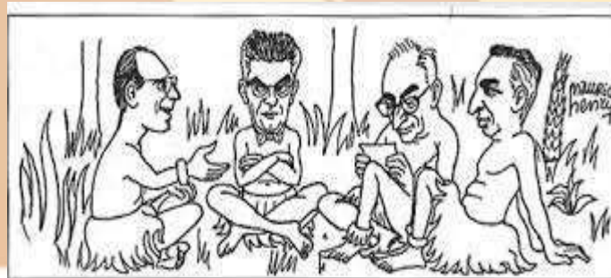
Cartoon by Maurice Henry, published in La Quinzaine Littéraire, 1 July 1967.