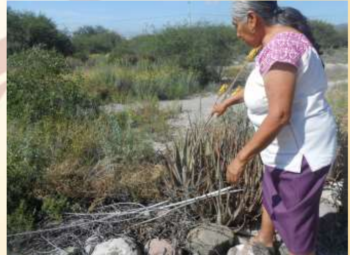
Autor: Soto Alarcón Jozelin María (2014)