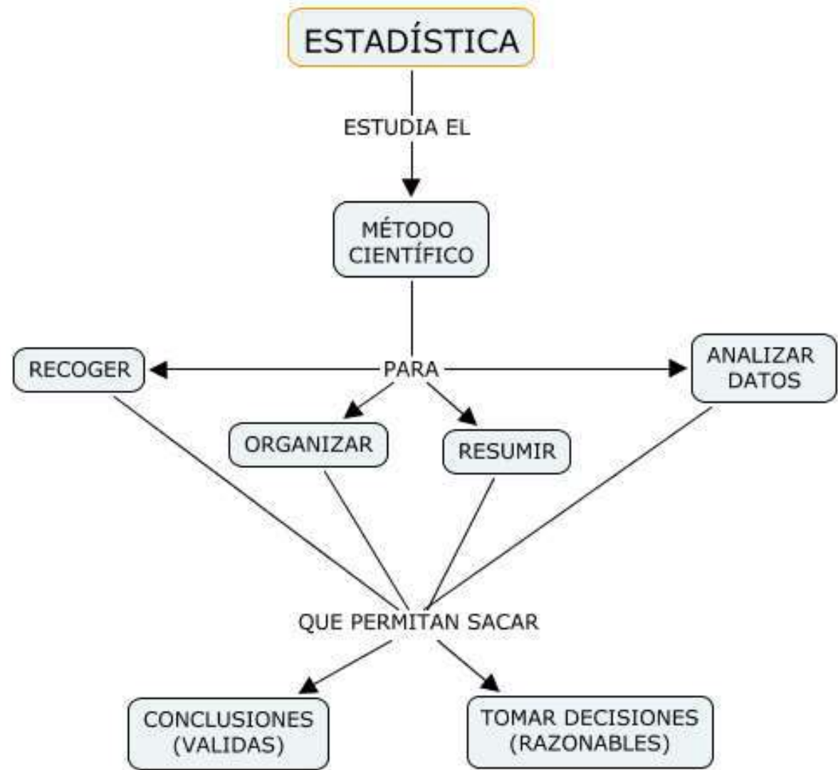
Fig.1 Cmaptools, mapa conceptual de la definición de estadística