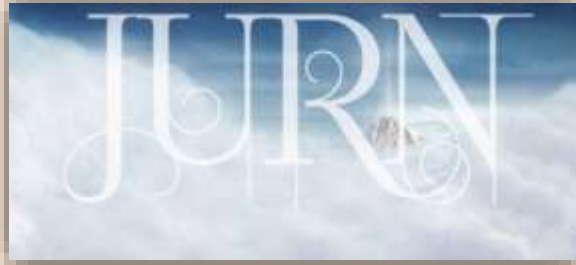
Figura 5. JURN