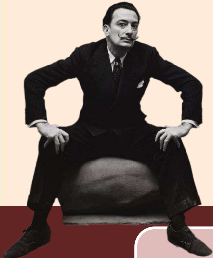
Plásticos y visuales