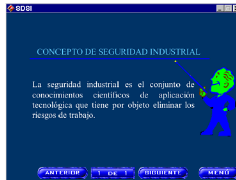
Figura 2. Concepto de seguridad Industrial.