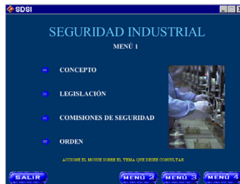
Figura 1. Menú principal.

A continuación se muestran algunas pantallas de los diferentes módulos que lo integran.