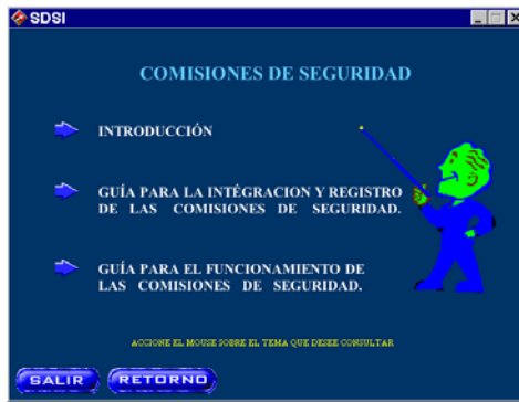
Figura 3. Comisión de seguridad.