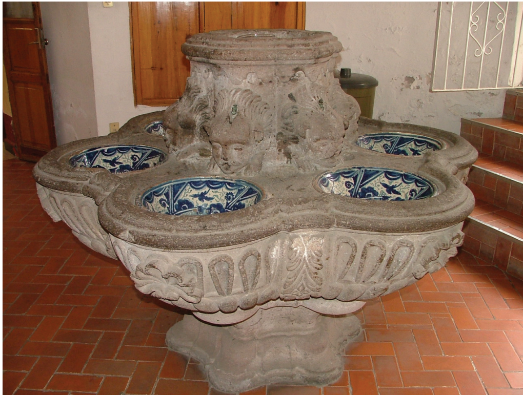
Lavamanos, Ex convento de San Francisco. Pachuca, Hgo.