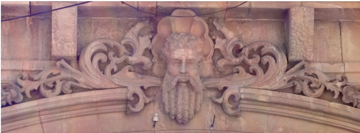
Detalle de fachada. Archivo General del Estado. Pachuca, Hgo.

Cajuela “de China y dentro de ella unas pulseras de perlas de rostrillo entero que pesaron cinco onzas a cuarenta pesos onza montan doscientos pesos” 266 , “una cajuela de China en que están las joyas” (3 ps.). 267