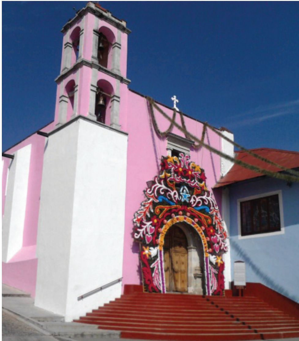
Santuario del Sr. de Zelontla. Mineral del Monte, Hgo.