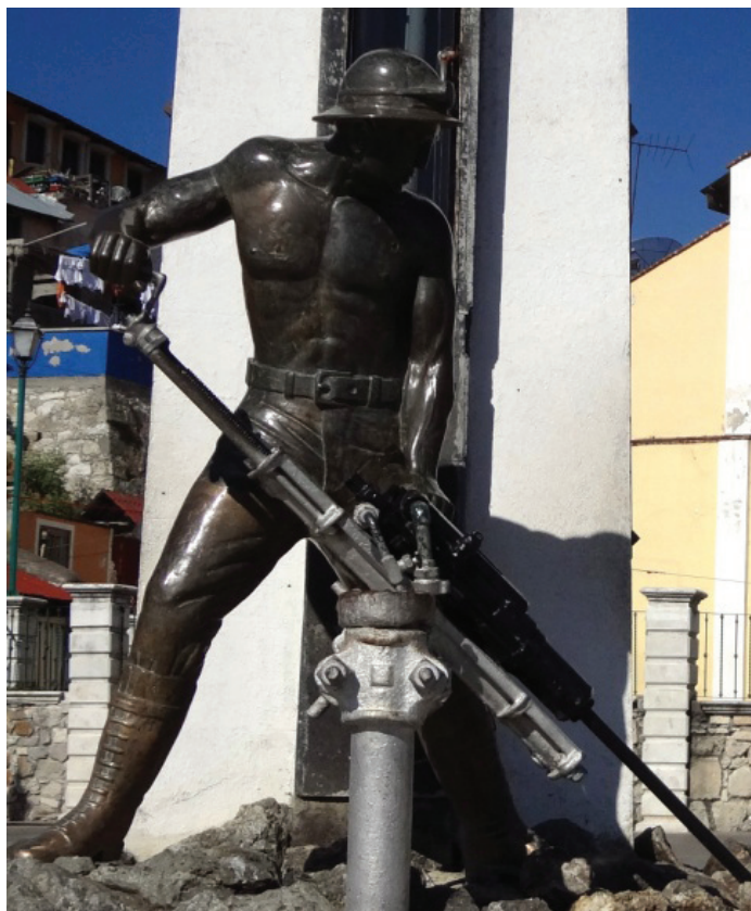
Monumento al minero. Mineral del Monte, Hgo.