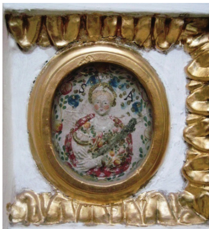
Detalle de medallón, altar del Niño Jesús. Iglesia de San Francisco. Pachuca, Hgo.

Aunque era mal visto, la sociedad toleraba que una mujer tuviera relaciones premaritales, ya que por la palabra de casamiento era común que la mujer perdiera su virginidad. 148 De aquí que los “embarazos secretos” fueron bastante comunes y, en estos casos, se usaron términos como “compromisos postergados” o ciertas formas de concubinato. 149 El hombre podía formalizar la relación para compensar a la mujer por sus favores, protegerla de la pobreza o prostitución, restituir su honor y legitimar a sus hijos, pero nadie podía obligarlo a casarse sin su consentimiento. Si el hombre no deseaba contraer matrimonio, ponía en tela de juicio la calidad moral, la conducta y el modo de vida de la mujer. 150