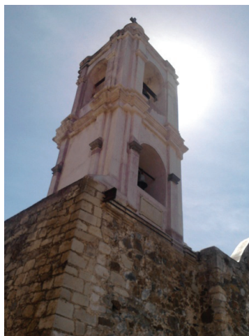
Torre de la Capilla de la Santa Veracruz, Real del Monte, Hgo.

A través del matrimonio se regulaba también la sexualidad, ya que se consumaba la unión de la pareja con el acto sexual, con el único objeto de procrear hijos. El matrimonio se definía entonces como “la sociedad legítima del hombre y la mujer, que se unían con vínculo indisoluble, para perpetuar su especie, ayudarse a llevar el peso de la vida y participar de una misma suerte”. 128