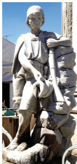
Estatua del Monumento a Miguel Hidalgo. Pachuca, Hgo.

En general, podemos decir que a partir de la década de los treinta del siglo XVII y durante el resto de este siglo se mantuvo en las Minas de Pachuca un abasto regular de productos provenientes del comercio exterior, por lo que este tipo de actividad fue una alternativa para el desarrollo de la región, en especial cuando la minería se encontraba en relativa crisis o no producía lo suficiente para sustentar a la población. Pachuca ofreció la plata extraída de sus minas a cambio de recibir estos productos, ya que como vimos algunas de éstas continuaron trabajando durante todo el siglo.