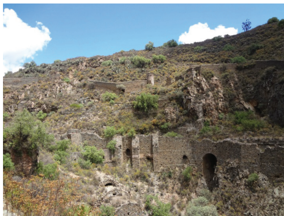
Vista de la Hacienda San Buenaventura.

Con el descubrimiento de la técnica alemana del sistema de amalgamación para el beneficio de la plata, introducida en Pachuca por el sevillano Bartolomé de Medina en 1555, 22 que empleaba el azogue o mercurio, se hizo necesario el continuo abasto de este escaso material. Una de las causas que provocaron la caída en la producción de plata en la Nueva España fue la dependencia de las remesas de azogue de las minas españolas de Almadén, municipio perteneciente a la provincia de Ciudad Real en Castilla-La Mancha, cuyas minas de mercurio se conocieron desde el siglo XII, las minas de Huancavelica en Perú, y las de Idria en la península independiente de Croacia y Eslovenia, repúblicas integradas a la antigua Yugoslavia. 23 La Nueva España se abastecía básicamente de las minas de Almadén y entre 1620 y 1645 se recurrió a las de Idria. 24 La regulación en el abasto de azogue y las políticas de la Corona en este ramo no favorecieron a las minas novohispanas. La distribución del azogue estaba en manos de la Corona y de algunas autoridades reales que recibían ganancias exorbitantes, además, en la década de 1630, las exportaciones de Almadén que llegaban a Veracruz se desviaron hacia Perú. Dos tercios de las minas novohispanas trabajaron con el método de amalgamación, por lo que la reducción y escasez de azogue provocó la ruina de muchas de ellas. 25