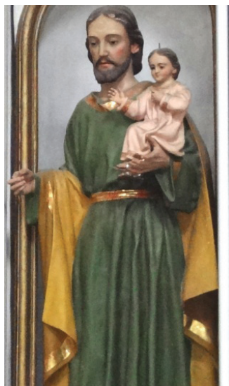
Escultura de San José. Iglesia Nuestra Señora del Rosario. Mineral del Monte, Hgo.