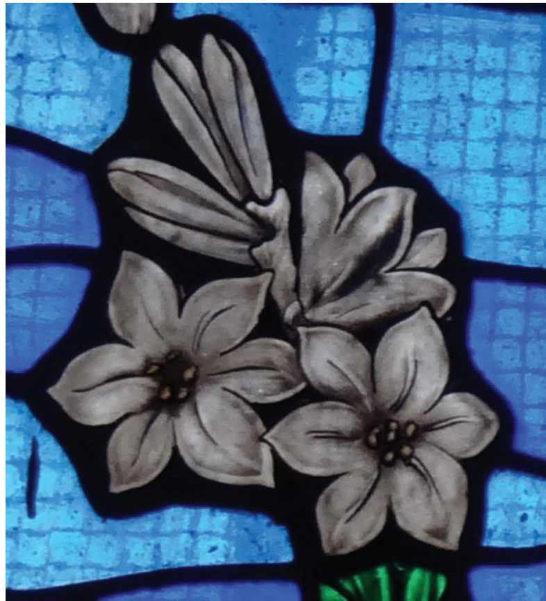
Detalle de vitral. Iglesia de la Asunción. Pachuca, Hgo.

“una piedra venturina en que está pintada Santa Inés guarnecida de filigrana de oro” (15 ps.) 403