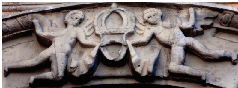
Detalle de la Iglesia de la Asunción. Pachuca, Hgo.

En la realidad muchas personas no seguían las enseñanzas de la Iglesia y los códigos morales eran violados constantemente, dando como resultado relaciones personales variadas y complejas. 144