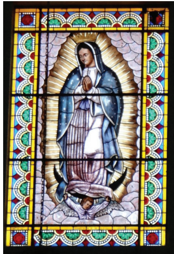
Vitral de Nuestra Señora de Guadalupe. Iglesia de San Francisco. Pachuca, Hgo.