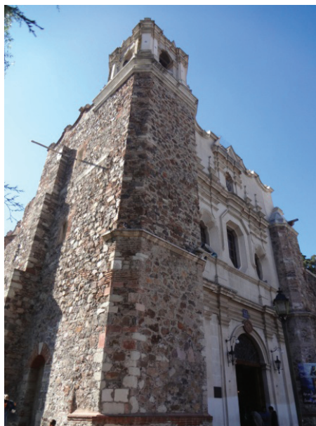
Iglesia de San Francisco, Pachuca, Hgo.