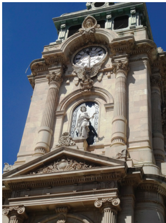
Detalle de la Torre del Reloj Monumental. Pachuca, Hgo.