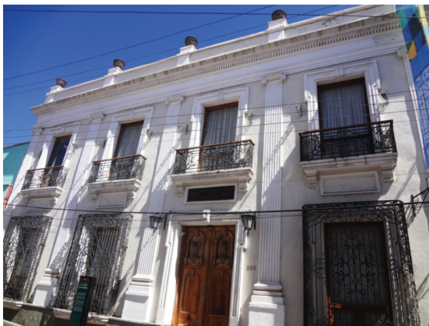
Foro Cultural Efrén Rebolledo. Pachuca, Hgo.

En una sociedad de apariencias, era necesario ofrecer una imagen ficticia de lujo y opulencia. La mujer reproducía estos valores dentro del ámbito que le era propio: el doméstico, ya que a ellas se les limitó su actuación en actividades públicas. Los bienes dotales, vistos como herencia a las hijas, nos ofrecen una visión de este ambiente femenino, pero a la vez nos dan a entender la importancia de exhibir el arte suntuario como medio de aceptación y prestigio social.