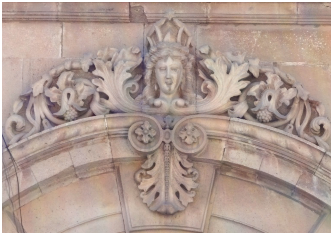
Detalle de fachada. Archivo General del Estado. Pachuca, Hgo.