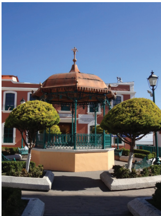
Kiosco. Mineral del Monte, Hgo.

Poderosos mineros como los Rivadeneira y los Castañeda “fijaban convenios, se hacían mutuamente determinadas concesiones, ocasionalmente compartían recursos; en pocas palabras, de alguna y otra forma establecían alianzas que incrementaban su poder económico y político”. 56