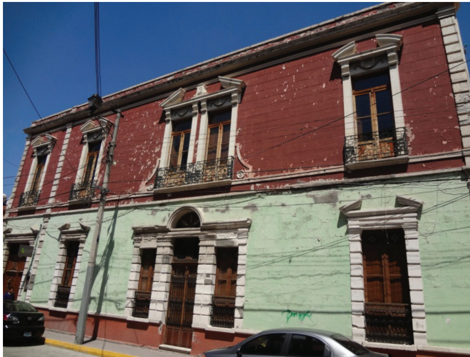
El Colegio del Estado de Hidalgo. Pachuca, Hgo.