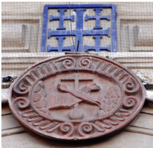
Monograma de los franciscanos. Portada de la Iglesia de San Francisco. Pachuca, Hgo.