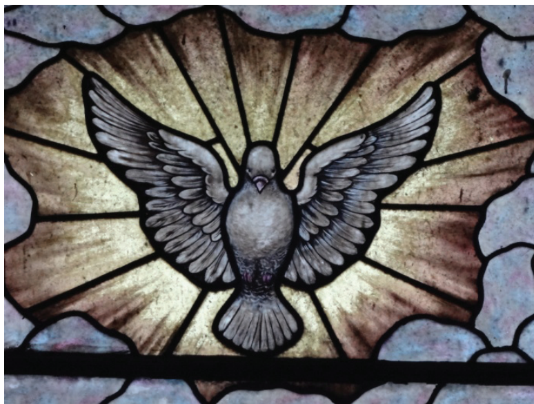
Detalle de vitral. Iglesia de la Asunción. Pachuca, Hgo.

Aparece en los documentos ropa exclusiva para bebé o para niño, ya que para ese entonces se confeccionaba este tipo de vestimenta, como babaderos de criatura, faldellincitos y nagüitas deshiladas.