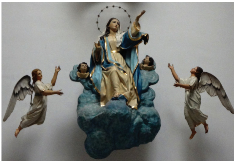
La Asunción de María. Iglesia de la Asunción. Pachuca, Hgo.