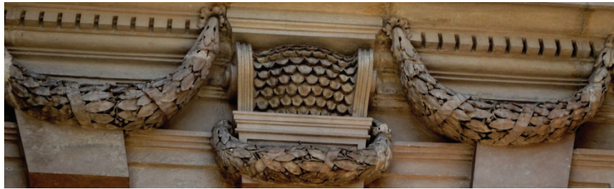
Detalle de la Torre del Reloj Monumental. Pachuca, Hgo.

El Galeón de Manila transportaba como sus principales productos sedas finas y brocados, porcelanas, lacas, especias, piedras preciosas y muebles, entre otros artículos de lujo. 74 Además de la plata novohispana, otros productos fueron objeto de comercio como cacao, vainilla, tintes, zarzaparrilla, cueros, entre otros.