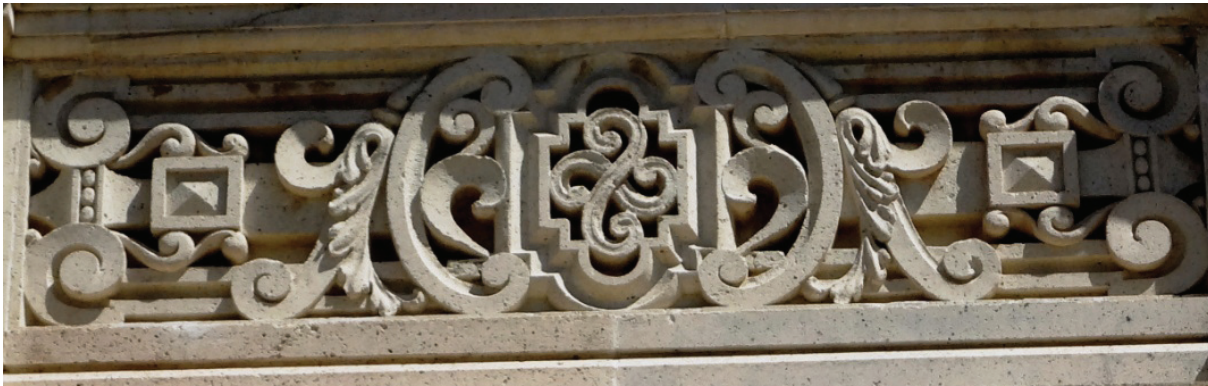
Detalle de la Torre del Reloj Monumental. Pachuca, Hgo.

Contrario a lo que se piensa, la crisis minera y la depresión del comercio ultramarino no hundieron la economía de la Nueva España, sino más bien se diversificaron las actividades relacionadas a la agricultura, por lo que la Nueva España logró poco a poco independizarse económicamente de España. La disminución en la producción minera y en el tráfico comercial obligó a los novohispanos a voltear los ojos a los recursos que les ofrecía su propia tierra, por lo que el siglo XVII fue de reestructuración económica y de aumento en la autosuficiencia productiva.