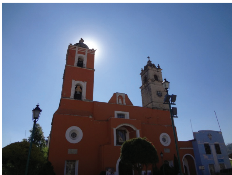
Iglesia Nuestra Señora del Rosario. Mineral del Monte, Hgo.

Como hemos visto, la minería y el comercio novohispanos estuvieron ligados durante todo el siglo XVII. En la región de Pachuca ambas ramas productivas mostraron un trabajo continuo, sin embargo, el tráfico de bienes y productos adquirió mayor relevancia.