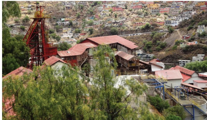
Vista de la Mina San Juan Pachuca. Pachuca, Hgo.

Por otro lado, la necesidad de obtener productos o bienes como herramientas e insumos para la minería, así como telas y objetos suntuarios, favoreció la actividad comercial en la Nueva España. En la búsqueda de abastecerse de objetos de lujo que les permitieran reflejar una posición social favorable, los sectores medios y altos de la población facilitaron la llegada de bienes traídos de diversos lugares del mundo, como se ve claramente en la región de Pachuca.