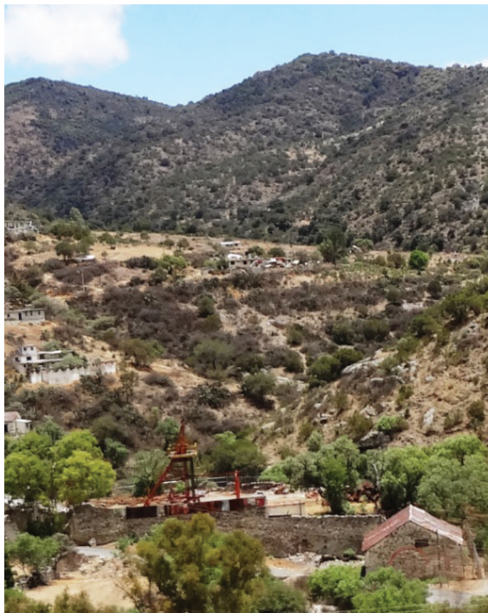
Vista de una mina. El Cerezo.

Los Castañeda fueron una familia que a través de alianzas matrimoniales lograron extender su fortuna y consolidar su posición de poder y prestigio. Las dotes que ofrecieron a sus hijas fueron generalmente las más altas.