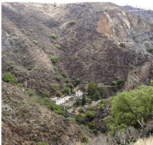
Vista de hacienda minera. Camelia.

A mediados del siglo XVIII todavía se empleaba el sistema de beneficio por azogue y, aunque en Real del Monte se continuaba sacando plata, que constituía el principal producto de comercio de la jurisdicción, se seguía padeciendo por las inundaciones de los socavones, debido a que la máquina de vapor para el desagüe se introdujo en la región hasta 1824. 39