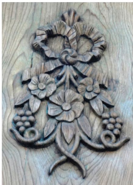
Detalle de puerta. Escuela Primaria Vespertina Profr. José Ma. Licona. Pachuca, Hgo.