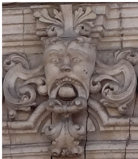
Edificio de las Cajas. Compañía Real del Monte y Pachuca. Detalle.

Contar con una Caja Real le dio a Pachuca un reconocimiento oficial, a pesar de que la producción de estos Reales no se comparaba con la de otros lugares como Guanajuato, Zacatecas, Durango o San Luis Potosí. 13 Las Cajas Reales administraban el mercurio y ahí los mineros cumplían sus obligaciones fiscales y se recaudaba el diezmo, es decir, se pagaban los impuestos de la plata que los mineros producían.