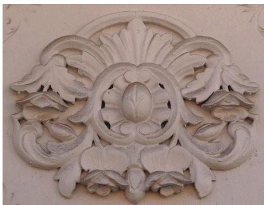
Decoración de Teatro Alameda. Pachuca, Hgo. Detalle.

La dote que recibía cada mujer al momento de casarse indicaba su posición social y económica, es por esto que los padres se preocupaban por dar a sus hijas, en la medida de lo posible, una buena dote, sin afectar el patrimonio familiar.