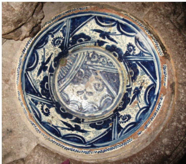
Plato de talavera, detalle de lavamanos, Ex convento de San Francisco. Pachuca, Hgo.