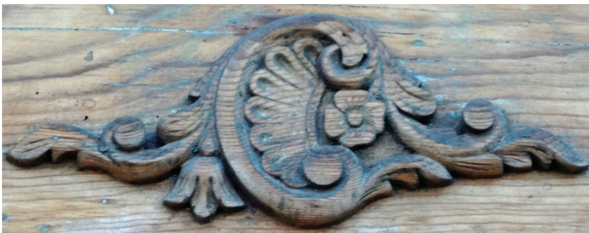
Detalle de puerta. Escuela Primaria Vespertina Profr. José Ma. Licon. Pachuca, Hgo.

Entre los objetos personales podemos señalar chapines, bolsas, sombreros y llaveros. Ocasionalmente cajitas de polvos, abanicos, peines, zapatos, guantes y pastillas de boca (dulces).