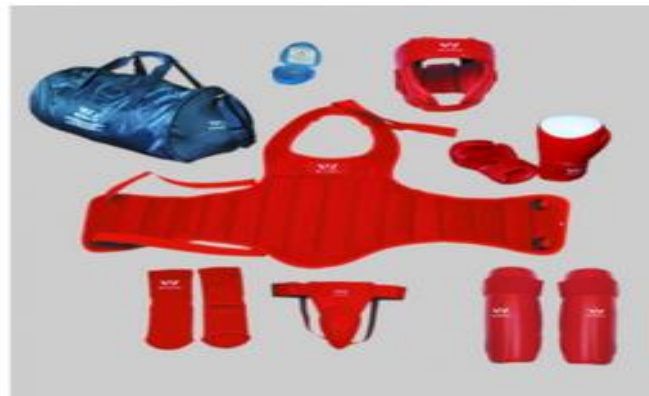
Figura E. Equipo de protección personal para combate Sanda (Wipitty)

El combate es otro aspecto dentro del arte marcial en el cual se usa un equipo de protección que consta principalmente de 4 partes para las áreas de cabeza, torso, manos, espinillas, elementos que son mostrados en la figura E, el cual por sus dimensiones generalmente solo es usado en el momento del combate, que resultan a veces incómodos para el usuario. Si bien el equipo la ropa deportiva a base del fluido no newtoniano para diversos deportes es un producto que en la actualidad la empresa D3O® ha comercializado, resulta un producto innovador la creación de un equipo de protección en base a este fluido para el entrenamiento de combate del Wushu, al que también se le denomina Sanda, el cual sea apropiado para esta práctica, sin dejar de considerar la efectividad y ergonomía del producto.