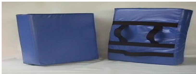
Figura B. Domi utilizado en los entrenamientos de artes marciales. (Mac sport ®)

Un ejemplo de artículo de entrenamiento usado en las artes marciales como lo son el taekwondo, judo, wushu, es el domi, mostrado en la figura B, el cual se emplea para ejercicios de fuerza y precisión con impactos de puño y pateo. Este artículo de apoyo se realiza con materiales como lo son la lona, vinil y hule espuma, que tiene un costo promedio de $400.00MN (Iker sport ®). Se realizó un experimento, en el cual, fueron usados materiales de fácil adquisición para probar la efectividad del producto. Los materiales empleados fueron agua, fécula de maíz y un globo. Se preparó la mezcla de agua y fécula de maíz hasta lograr la consistencia deseada, se vertió el producto en el globo. Finalmente el producto fue probado, y se comprobó que éste es adecuado para el fin buscado, y se tiene la posibilidad de ser usado de diversas maneras acorde al enfoque del entrenamiento, ya sea, fuerza, rapidez, precisión, etcétera.