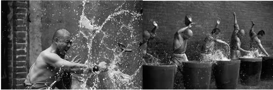
Figura C y D. Entrenamiento Shaolin con agua.

El combate es otro aspecto dentro del arte marcial en el cual se usa un equipo de protección que consta principalmente de 4 partes para las áreas de cabeza, torso, manos, espinillas, elementos que son mostrados en la figura E, el cual por sus dimensiones generalmente solo es usado en el momento del combate, que resultan a veces incómodos para el usuario. Si bien el equipo la ropa deportiva a base del fluido no newtoniano para diversos deportes es un producto que en la actualidad la empresa D3O® ha comercializado, resulta un producto innovador la creación de un equipo de protección en base a este fluido para el entrenamiento de combate del Wushu, al que también se le denomina Sanda, el cual sea apropiado para esta práctica, sin dejar de considerar la efectividad y ergonomía del producto.