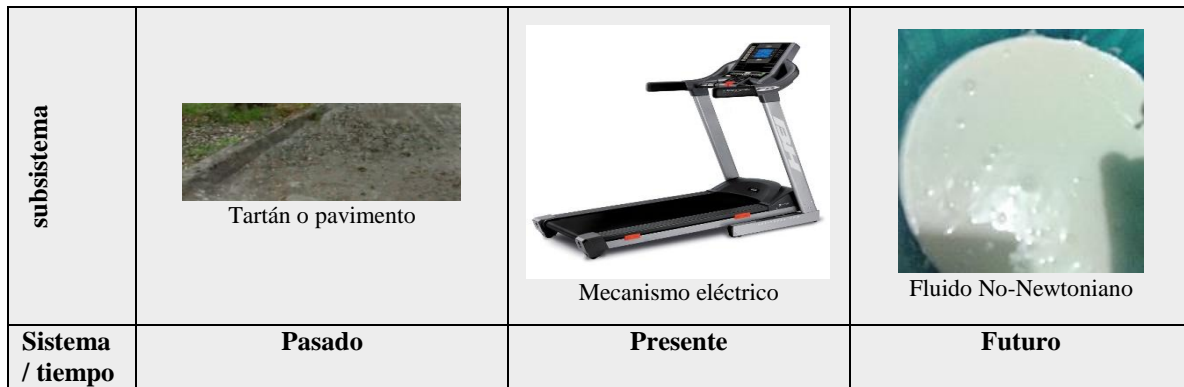
Tabla 2: Caso B. Representación en el diagrama de 9 celdas en el ejercicio de correr. (Elaboración propia, Walmart ®, Notifighth, Fitness Experts, Metro)

Al tomar como ejemplo la resistencia física, que es la capacidad que tiene un apersona para mantener un esfuerzo el mayor periodo de tiempo posible (Departamento de educación física, 2015), el correr al aire libre es la forma más elemental, sin embargo se cuenta con pocos espacios adecuados para la realización de esta actividad, posteriormente tanto en los hogares como en gimnasios se encuentran aparatos de alto precio como lo son las caminadoras eléctricas. El uso del fluido no newtoniano para este propósito por su composición demanda mayor resistencia, lo que permite desarrollarse de manera más efectiva, con un costo menor y que se muestra adaptable al espacio.