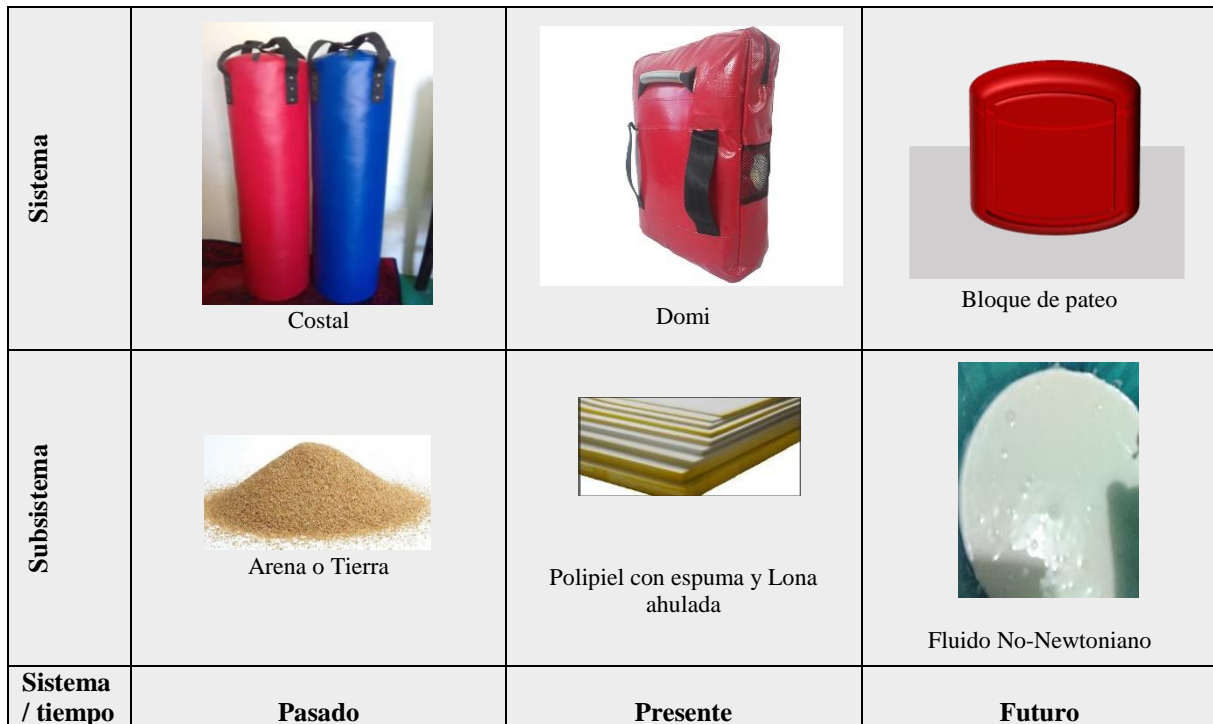
Tabla 1: Caso A. Representación en el diagrama de 9 celdas del Domi. (Elaboración propia, Gimnasio de entrenamiento CASDT)

Al analizar el caso A de la tabla 1 anterior se observa la evolución del sistema utilizado, en este caso un domi, el cual comenzó como costales rellenos de arena los cuales podían causar lesiones a los practicantes, posteriormente surgieron nuevos diseños con materiales más aptos y resistentes como lo es el polipiel con espuma y lona ahulada que es más resistente. La propuesta que se plantea es una mejora al sistema ya existente, al crear un bloque de pateo que en el interior contenga fluido no-newtoniano, dado que su diseño permite un mejor rendimiento acorde al requerimiento de cada practicante y se obtendrá una adecuada ejecución de la técnica de pateo.