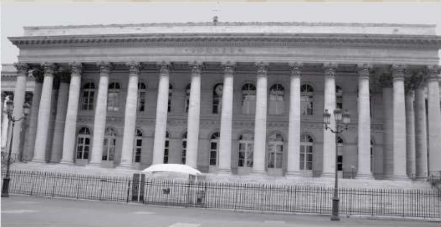
La Bolsa de París

-Donde se producen cambios mas notables es en la decoración interior donde se incluyen temas egipcios con esfinges, pirámides y flores de loto estilizadas y otros de tipo militar representativos de las campañas bélicas de Napoleón.