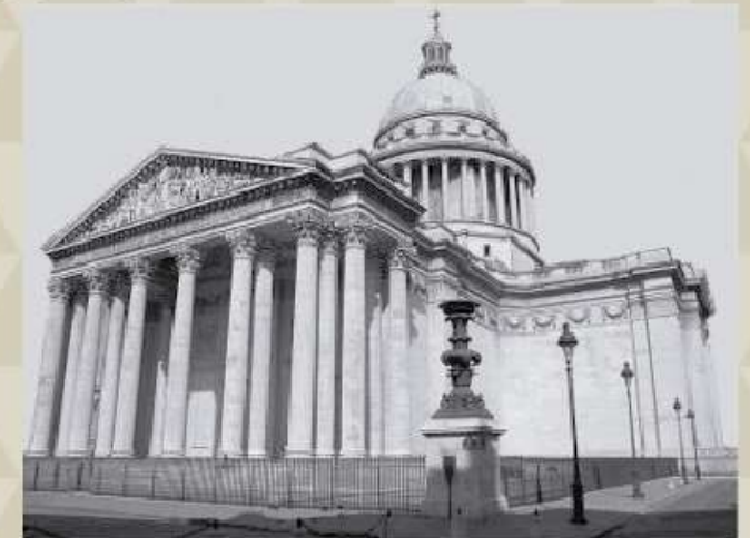
El Panteón de París.