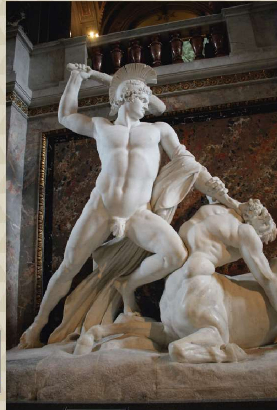
Canova. Teseo en lucha con un centauro.