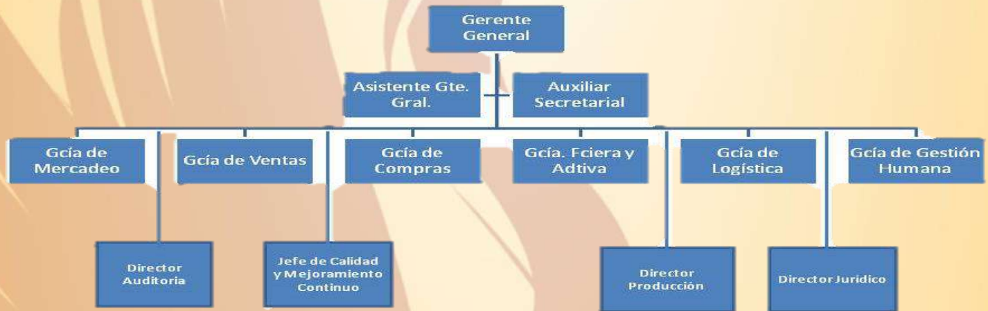
Tabla 2 (Comportamiento Organizacional, 2012) Mapa conceptual

Dentro de una empresa pequeña que aplica la estructura organizacional lineal, los empleados responderán a un supervisor, quien a su vez responderá a un gerente general. En este modelo sólo el gerente tiene la autoridad total y el grado de responsabilidad de tareas recae principalmente sobre los empleados.