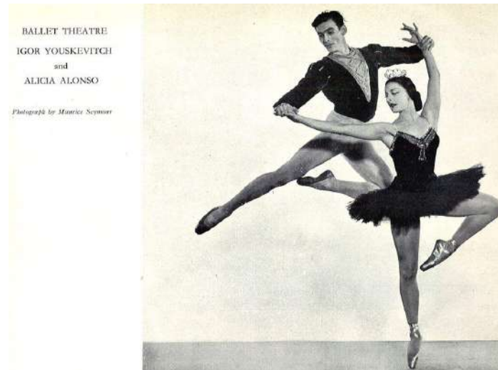
Foto: Alicia Alonso_Igor Youskevitch.

https://www.danzaballet.com/UserFiles/Image/4/Image/ENTREVI.jpg