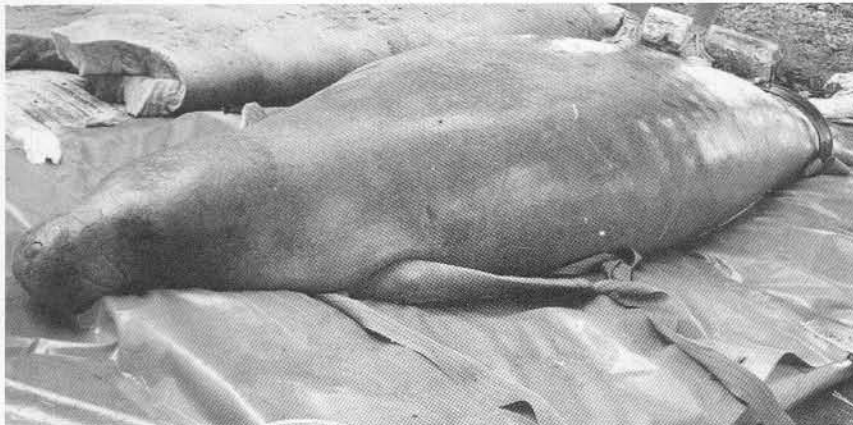
Figura 1: Foto de un manatí hembra que está siendo pesada y medida antes de ponerle un radio trasmisor

En México, la distribución del manatí se encuentra a lo largo de la costa del Golfo de México, abarcando desde el río Panuco, Veracruz, hasta el sur de Quintana Roo (COLMENERO-ROLON, 1984; COLMENERO-ROLON & HOZ-ZAVALA 1986; MORALES-VELA, 2000). Sin embargo, en la actualidad sólo son relativamente abundantes en los humedales, de los estados de Veracruz, Tabasco, Chiapas y Campeche, en el Golfo de México y en