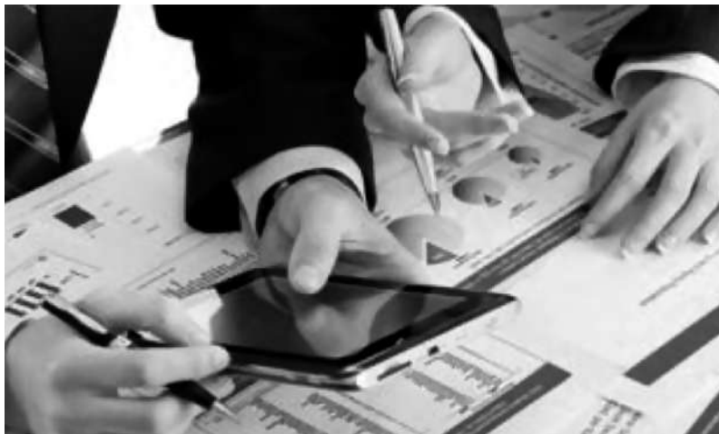
Imagen 2. Licenciado en Contaduría.