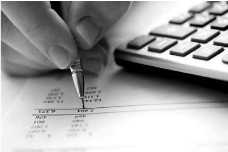
Imagen 1. Licenciado en Contaduría.