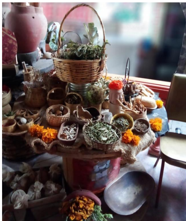
Figura 3. Ofrenda puesta en la casa de la medicina tradicional

Este conocimiento ancestral de la ofrenda a la tierra, en el penúltimo mes del año, se realiza como agradecimiento al ciclo de cultivo que va terminando y según la Comisión nacional para el conocimiento y uso de la biodiversidad (CONABIO, 2020), los rituales establecen relaciones simbólicas entre las personas, sus dioses y su ambiente natural por lo tanto expresan la cosmovisión de las culturas, "La cosmovisión es recreada a través del ritual. Los rituales involucran un conjunto de prácticas y símbolos (ofrendas, danzas, cantos, gestos o actuaciones), y se llevan a cabo repetitivamente" (pp.2-3). Igualmente se menciona a Tláloc en relación a la etapa de germinación de la tierra, menciona Broda (2020) que "El culto a Tláloc reflejaba el proceso de una milenaria tradición de la observación del medio ambiente y de los procesos naturales. Estas observaciones también eran necesarias para las prácticas agrícolas y el exitoso cumplimiento del ciclo del cultivo del maíz" (p. 15).