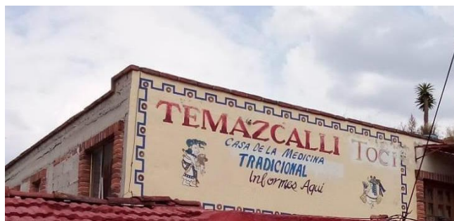
Figura 1. Casa de la medicina tradicional

La muestra final fue de 4 participantes que resultaron ser todas mujeres. Al respecto, se aprecia que la existencia de médicas/os tradicionales en la actualidad es cada vez más escasa.