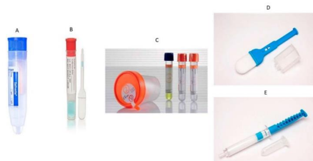
Figura 2: Representación de diferentes dispositivos de recolección de saliva utilizados en el muestreo de enfermedades infecto-contagiosas (34).