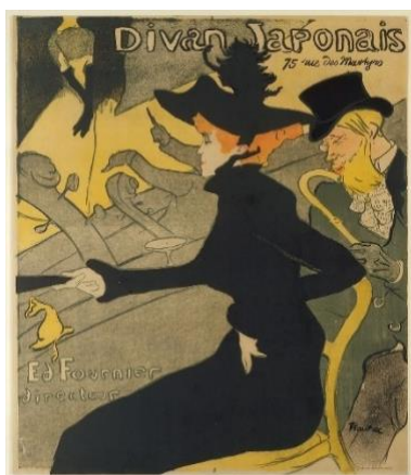
Imagen 1. Toulouse-Lautrec. (1893). Divan Japonais.

Según Mejías (2017), entre el siglo XIX y XX, la figura femenina se concebía casi como una divinidad, fue en esta época del Art Nouveau o modernismo cuando la mujer se asumía como delicada, expresando elegancia, finura, sofisticación y buen gusto. Un representante destacado de este movimiento fue el pintor, diseñador gráfico, y publicista, Toulouse-Lautrec. El medio de publicidad más importante de esa época eran los carteles, siendo estos llamativos con una imagen clara y precisa con el fin de captar la atención del público (Imagen 1).