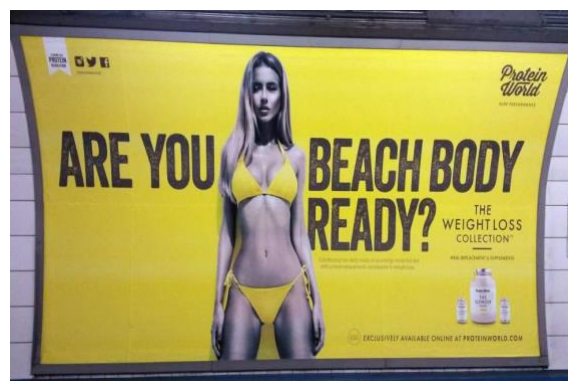
Imagen 6. Protein World (2015). Anuncio publicitario.

La publicidad presentaba un cuerpo femenino cada vez más alejado de la realidad, exaltando la juventud y la belleza como sinónimo de valor, perpetuando el “culto al cuerpo”. Aún en la actualidad, existen marcas y anuncios publicitarios (imagen 6) que establecen un canon de belleza inalcanzable que no representan a las mujeres reales, sin embargo, su recurrencia e insistencia provoca tal incertidumbre que la sociedad finalmente lo acepta como normal, deseable por los consumidores Mejías (2017).