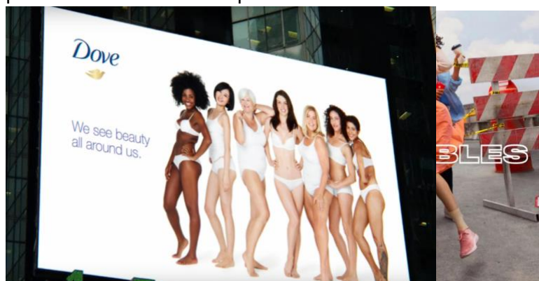
Imagen 7. Dove (2004). Campaña publicitaria “ Real beauty campaign ”.

Afortunadamente, son más las marcas y campañas publicitarias que asumen una posición distinta de la mujer, desligada de esa imagen estereotipada. La marca Dove, perteneciente a la multinacional Unilever, desde el año 2004, se ha esforzado en su publicidad por difundir la imagen femenina más realista; con mujeres normales y diversas (Imagen 7), fuera de los estándares prestablecidos o estereotipados de belleza.