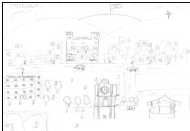
Figura 4: Dibujo producto de la elaboración de la estudiante catalogada como “número seis”. Considerado el dibujo más “complejo”.

Arcos de Plaza Juárez, el Kiosko de la Plaza Independencia y algunas casas y edificios a modo de paisaje. Presenta algunos automóviles, personas, áreas verdes, nubes e incluso un título a su dibujo: “Pachuca”. Sólo escribe dos nombres o etiquetas para señalar sus sitios de referencia (Palacio de Gobierno y UAEH). Con relación a los datos mencionados por la Estudiante “6” en los otros instrumentos de texto se encuentra que ella proviene de la Ciudad de Sahagún y son correspondientes con lo representado en su dibujo: Palacio de Gobierno, Portales de Plaza Juárez, el Reloj Monumental y sus parques a los alrededores (principalmente en la Plaza Independencia). Así como lo refiere Licona, 2001 en su aportación escrita no es tan explícita como en sus dibujos.