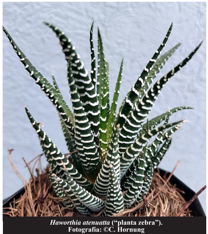
Haworthia attenuata (“planta zebra”).