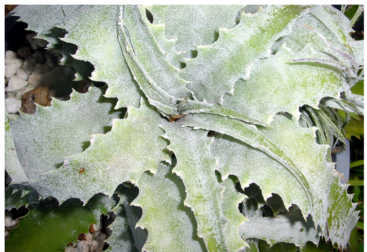
Roseta de Hechtia lanata (Bromeliaceae).