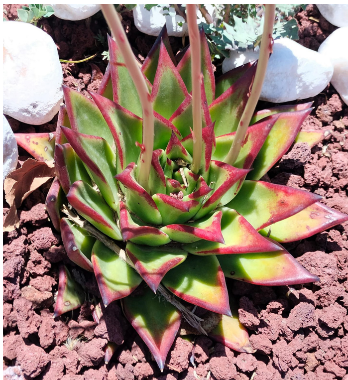
Distribución de las hojas en roseta Echeverria agavoides .