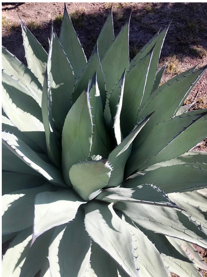
Roseta de Agave applanata .