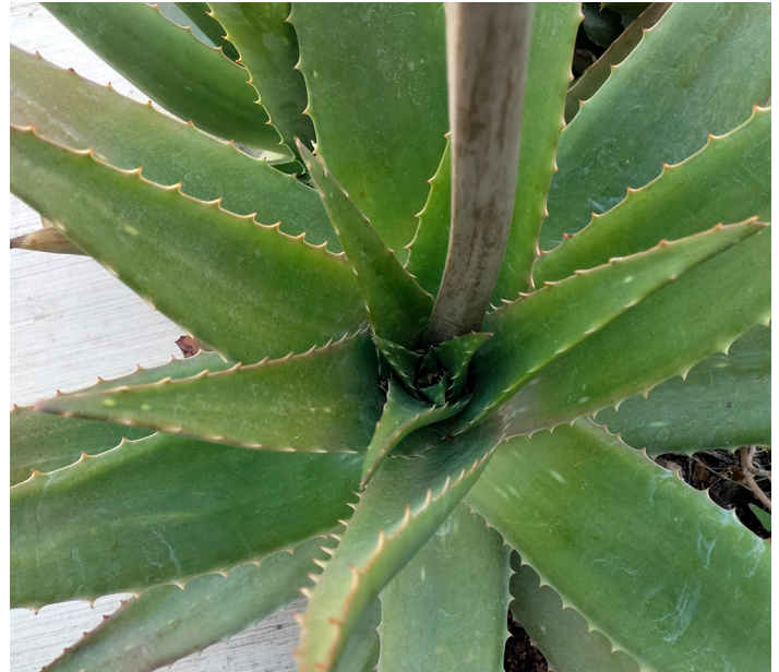
Planta de sábila ( Aloe vera ).

La distribución de plantas arrosetadas no está restringida geográficamente, por lo que existen especies que se encuentran en Asia (como narcisos) y otras con distribución en América como los agaves (magueyes) y las sábilas ( Aloe spp.) en África. En familias como las compuestas (Asteraceae: familia del girasol), un ejemplo muy bonito de plantas arrosetadas son los conocidos como “frailejones” ( Espeletia sp.) en Sudamérica y los “senecios” ( Kenyodendrum sp.) en África; aunque en estos últimos no todos tienen esta forma arrosetada. Algunas de estas formas en diversas familias, quedaron separadas geográficamente al dividirse en Sudamérica y África, por lo que en ambos continentes hay representantes arrosetados.