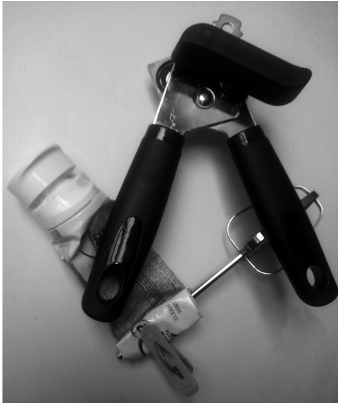
Composición artística que representa uno de los inventos del Dr. Kerstupp, “La palomita” ahorradora de pasta de dientes.

con las manos. “Hace muchos años había unas latas de sardinas que traían una palomita para abrirlas, y de allí tomé la idea”. Me explica que la lata tenía en su tapa de metal una lengüeta a la que venía soldada una paloma a la que se daba vuelta para enrollar la lámina y abrir el empaque. “Pero con la pasta de dientes no podías tener lengüetita, entonces el chiste era hacer una palomita que encajara perfectamente”. Él se refiere a que esta paloma se debía deslizar horizontalmente al final de la pasta de dientes, sobre el primer doblado de tubo. “Y así hice mi invento”. Él me indica que, como en la ocasión anterior, necesitó que alguien le hiciera el molde. “Para esto había un señor de Toluca que fabricaba moldes de plástico. Este cuate era muy bueno para hacer eso, muy fino, porque tenía mucha curia. Hacen el molde en fierro, lo maquinan, todo atornillado, con terminaciones perfectas. Lo ponen en una maquina especial y te hacen lo que tú quieras. Yo le dije al señor: Oye, ¿por qué no me haces esta llave?