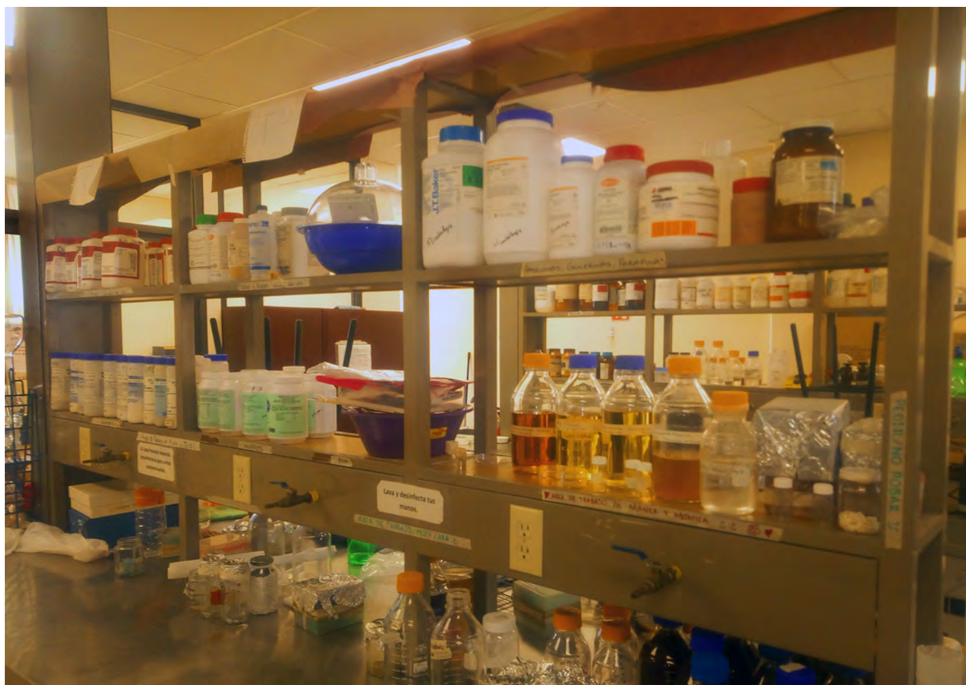
Productos químicos almacenados en frascos en un laboratorio de química en la Universidad Autónoma del Estado de Hidalgo.