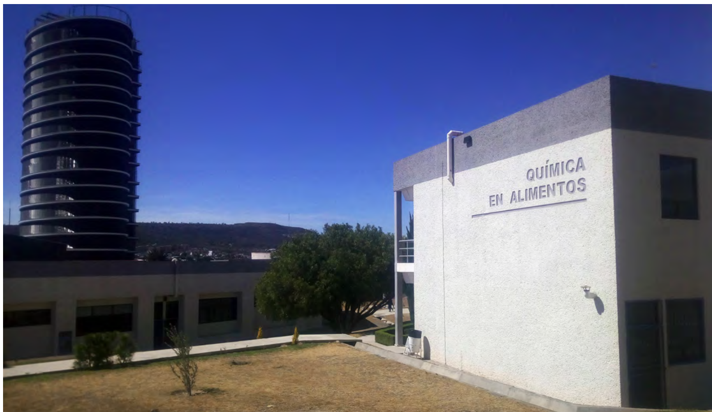
Edificio de Química en Alimentos, donde trabajó, como Profesor-Investigador, el Dr. Kerstupp, en el Instituto de Ciencias Básicas e Ingeniería de la Universidad Autónoma del Estado de Hidalgo, en Mineral de la Reforma, Hidalgo, México.

El interés del Dr. Kerstupp por los inventos inició desde pequeño. “¡Desde chiquillo fui muy creativo y muy inquieto! En aquel entonces soñaba con un aparatito con movimiento perpetuo”, me dice, y recuerda que jugaba con imanes buscando su objetivo. Me indica, con cara de desilusionado, “Era una falacia, porque el movimiento no lo puedes separar de la energía”.