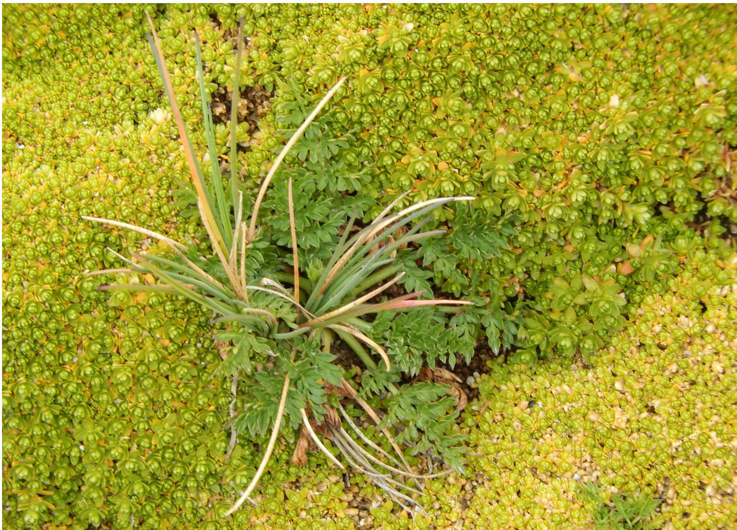
Acercamiento a las flores sésiles de una planta en cojín albergando a otra especie.