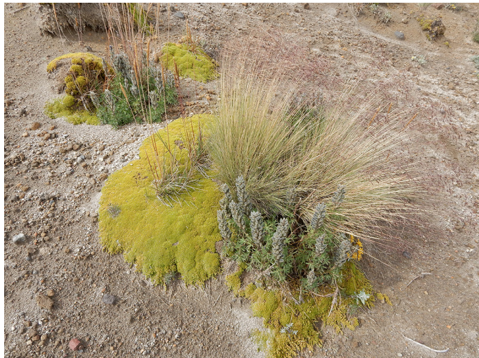
Influencia de Arenaria bryoides en el establecimiento de otras especies de pastos y herbáceas, con lo que modifica la estructura y diversidad de la alta montaña.