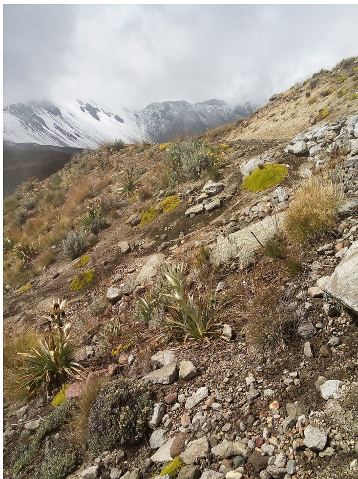
Panorámica del hábitat de las plantas en cojín a más de 4,000 m de altura en el Nevado de Toluca.