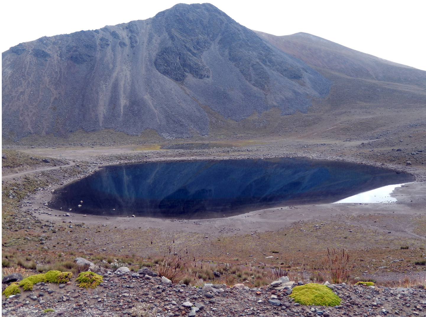
Panorámica del hábitat de las plantas en cojín a más de 4,000 m de altura en el Nevado de Toluca.