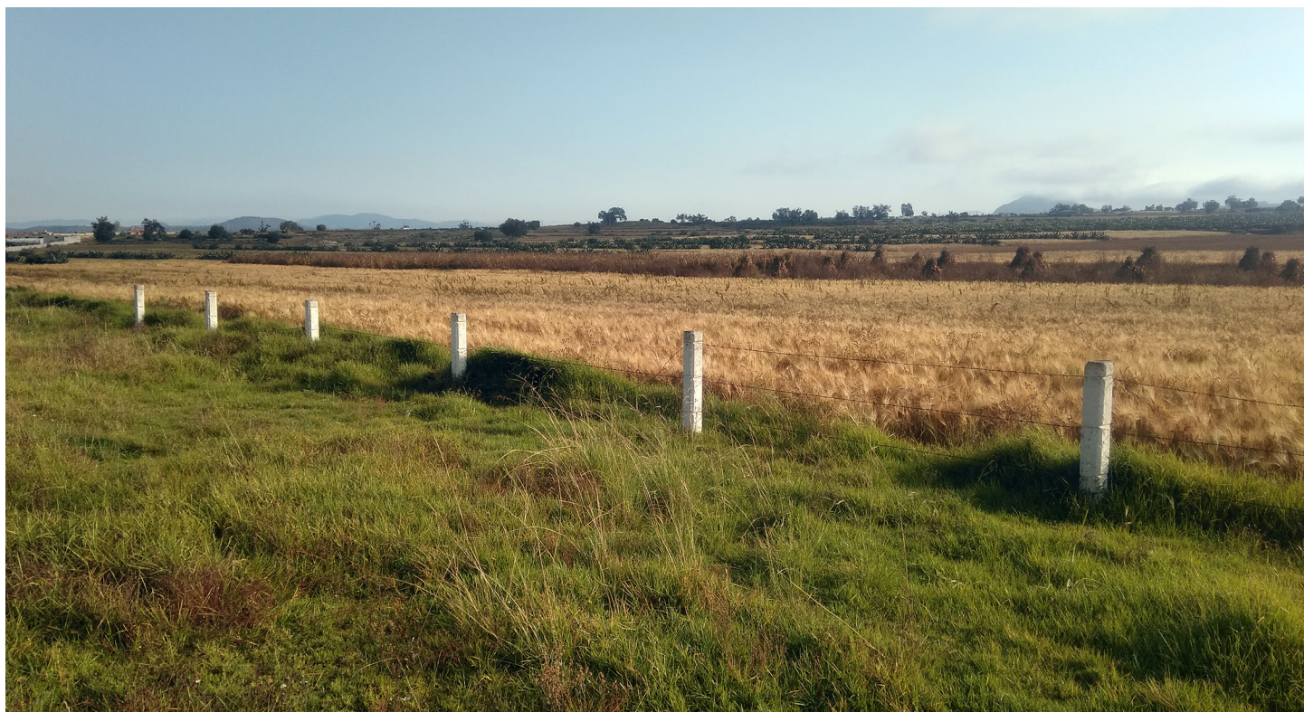
Zonas de cultivo afectadas por dispersión aérea del contaminante.