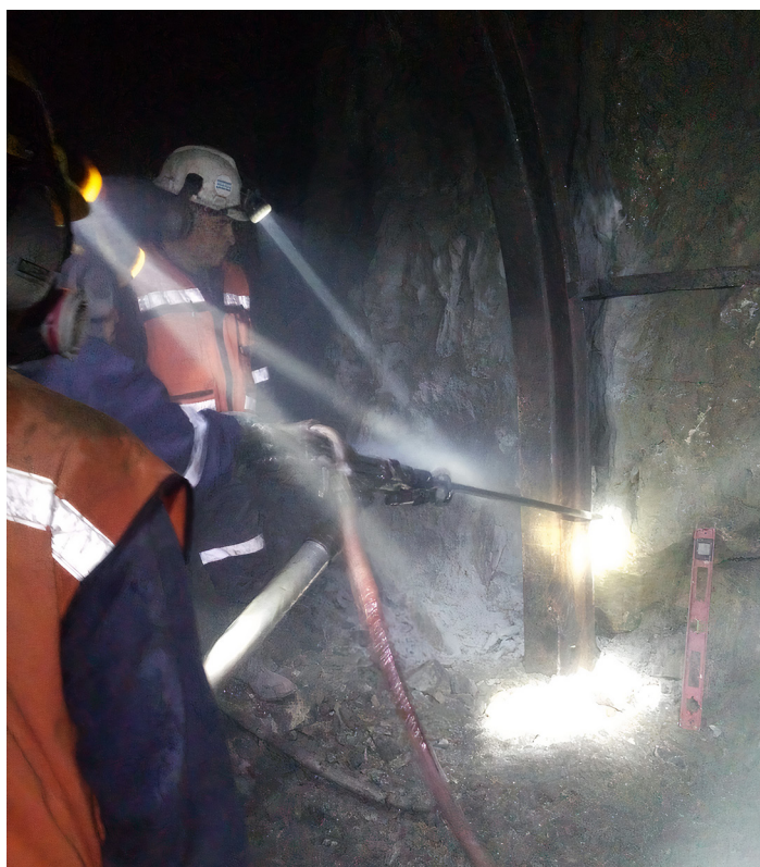
Miñeros preparando perforaciones. Mina "El Espíritu", Zimapán, Hidalgo.

Algunos desechos del cianuro son tratados actualmente por métodos químicos eficientes y con buenos resultados. Sin embargo, son costosos y lamentablemente pueden generar subproductos más tóxicos que los iniciales. En la búsqueda de tecnologías alternativas para degradar el cianuro que no generen subproductos tóxicos y que no dañen más el entorno, se han impulsado investigaciones enfocadas en la biorremediación, para sustituir los métodos convencionales como son la adsorción, la conversión química y el tratamiento electrolítico.