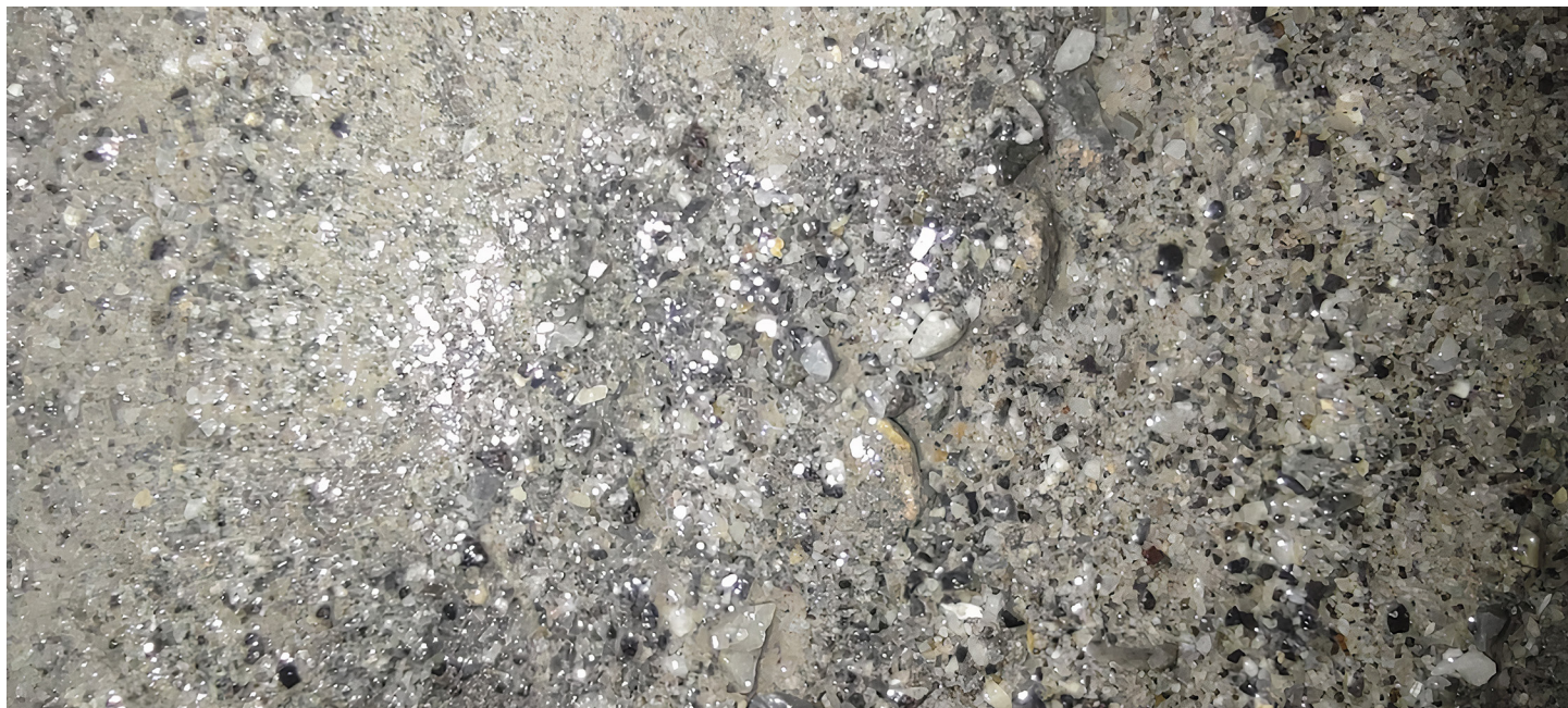
Suelo contaminado por cianuro.