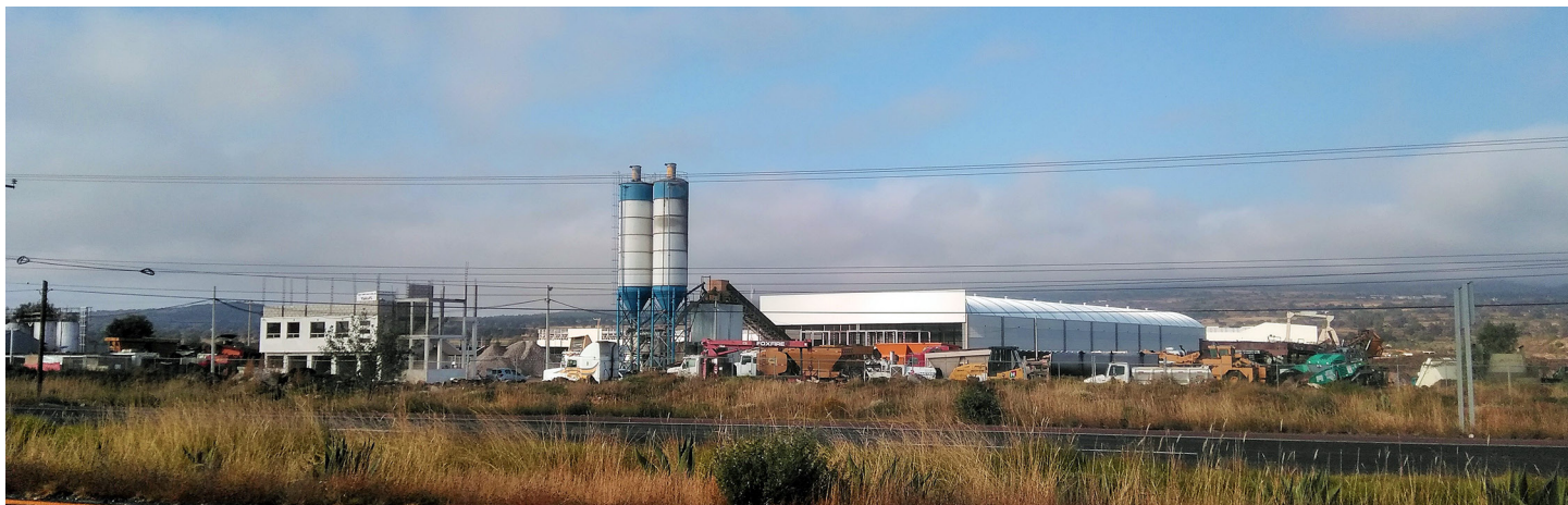
Ejemplo de transporte de contaminantes desde los sitios de producción hasta las zonas aledañas.

distintas concentraciones de cianuro, ya que no presentan envenenamiento sujeto a la sustancia, debido a que han desarrollado mecanismos de resistencia ante este tóxico, como la síntesis de una enzima llamada “oxidasa” insensible al cianuro. Las bacterias reportadas con esta capacidad se encuentran en la Tabla 1, tanto nativas como exógenas o que han sido modificadas genéticamente, con la finalidad de mejorar su eficacia. Además, las bacterias son capaces de fijar el cianuro dentro de sistemas aeróbicos y anaeróbicos, siendo más favorable el sistema aeróbico al tener un mayor porcentaje de remoción (Calisaya y Castillo, 2020).