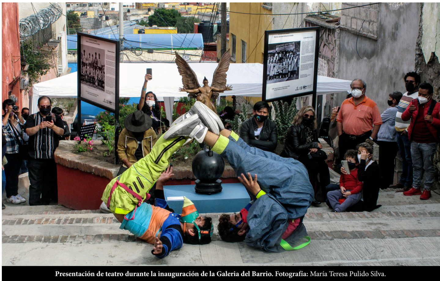
Presentación de teatro durante la inauguración de la Galería del Barrio.

en las calles y, además, atender las cuestiones ambientales que tan olvidadas están en las zonas urbanas, ya que no solo se intervinieron las jardineras, sino que se dieron pláticas con los vecinos sobre la importancia de mantener áreas verdes en las ciudades y sobre la diversidad biológica, tanto de plantas como de polinizadores que se pueden encontrar en la zona centro de Pachuca.