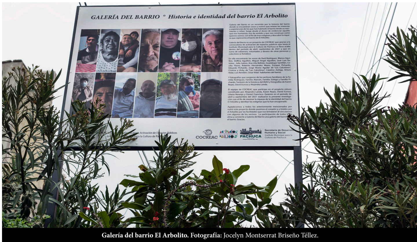
Galería del barrio El Arbolito.