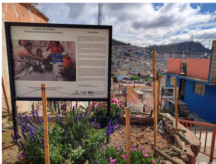
Proyectos Galería del Barrio en conjunto con Néctar para reactivar jardinerías en El Arbolito.