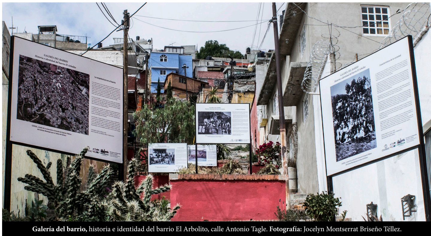
Galería del barrio, historia e identidad del barrio El Arbolito, calle Antonio Tagle.

Una de las características importantes de El Arbolito es su estructura urbana, marcada por pequeñas calles y callejones, además de ubicarse en una zona de alto riesgo por sus elevadas pendientes y distinguirse por poseer pocas áreas verdes o recreativas (Linares y Avilés, 2014). Con el transcurso del tiempo, El Arbolito ha sido marcado por la marginación y el estigma social.