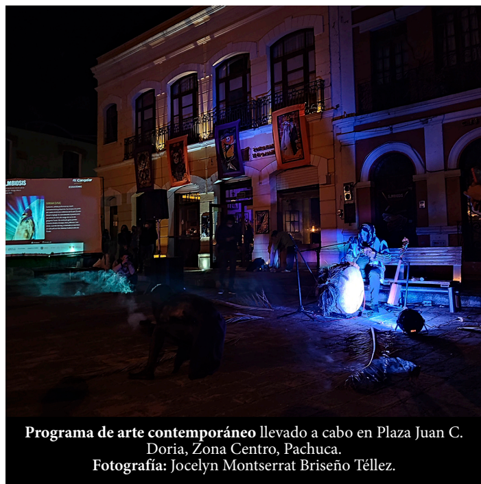
Programa de arte contemporáneo llevado a cabo en Plaza Juan C. Doria, Zona Centro, Pachuca.