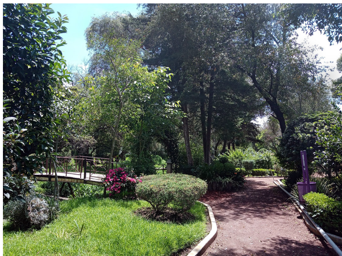
Aspecto del parque Tizatlán en Tlaxcala, Tlax.