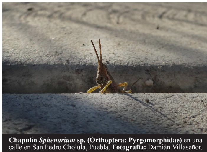
Chapulín Sphenarium sp. (Orthoptera: Pyrgomorphidae) en una calle en San Pedro Cholula, Puebla.