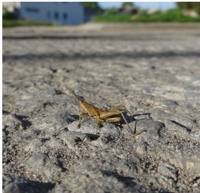
Chapulín Sphenarium sp. (Orthoptera: Pyrgomorphidae) cruzando una calle de San Pedro Cholula, Puebla.

Woodruff, D. S. (2001). Population, species, and conservation genetics. Encyclopedia of Biodiversity , 811–829. https://doi.org/10.1016/B0-12-226865-2/00355-2