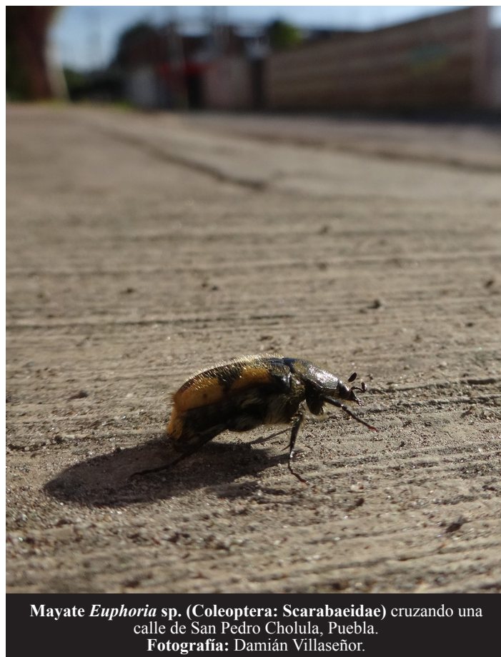
Mayate Euphoria sp. (Coleoptera: Scarabaeidae) cruzando una calle de San Pedro Cholula, Puebla.