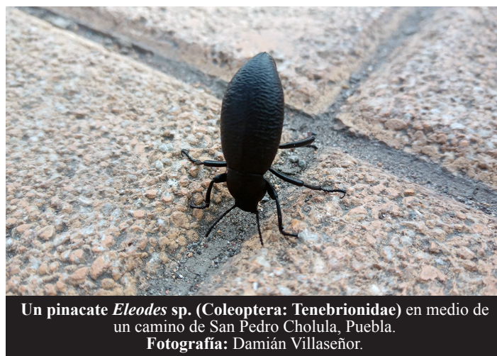
Un pinacate Eleodes sp. (Coleoptera: Tenebrionidae) en medio de un camino de San Pedro Cholula, Puebla.