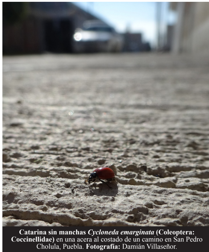
Catarina sin manchas Cycloneda emarginata (Coleoptera: Coccinellidae) en una acera al costado de un camino en San Pedro Cholula, Puebla.

A pesar de los ejemplos anteriores, realizamos una búsqueda exhaustiva en la literatura sobre insectos no voladores rurales y urbanos que han podido mantener su conectividad, a pesar de la existencia de vialidades y asentamientos humanos. Para nuestra sorpresa, encontramos la existencia de siete especies de insectos cursores, cuyas poblaciones están conectadas pese a la presencia de vialidades e infraestructura urbana: el escarabajo Bembidion lampros