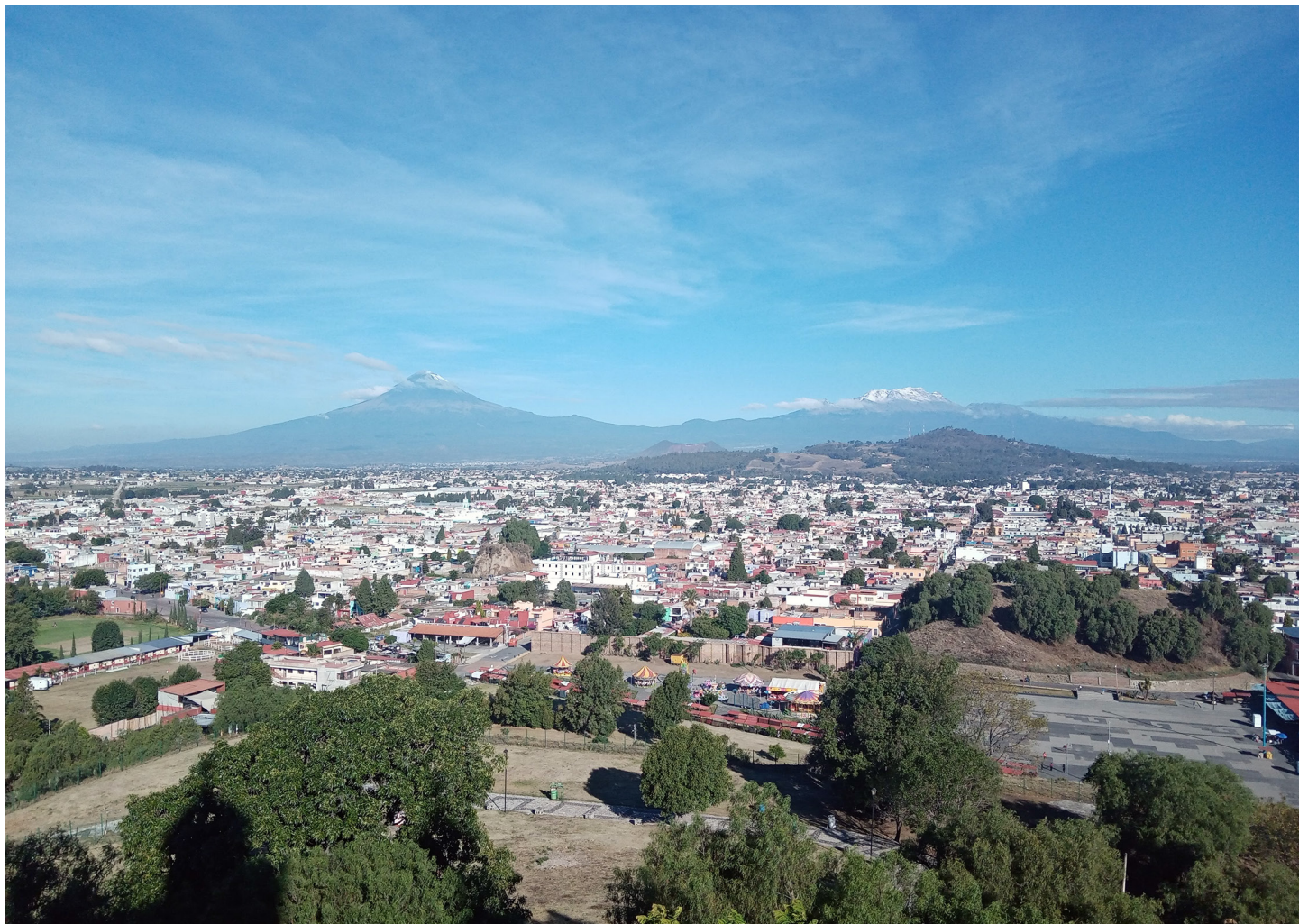
Panorámica de la ciudad de San Pedro Cholula, Puebla.

en Kallø y Bjerringbro, Dinamarca (Marchi et al. , 2013), la hormiga armada o marabunta, Eciton burchellii , en el bosque de San Lorenzo, Panamá (Pérez-Espona et al. , 2012), el escarabajo Geochus politus en Auckland, Nueva Zelanda (Brav-Cubitt et al. , 2022), los saltamontes Stethophyma grossum y Gomphocerippus rufus en Oberaagau, Suiza (Keller et al. , 2013a; 2013b), la esperanza Metrioptera bicolor en Hassberge, Alemania (Heidinger et al. , 2013) y el grillo de la madera, Nemobius sylvestris , en la isla de Wight en Inglaterra (Watts et al. , 2016). Pero, ¿cómo es que estos insectos mantienen la conexión entre sus poblaciones? El escarabajo Geochus politus cruza las vialidades durante periodos de inundación (Brav-Cubitt et al. , 2022) para evitar las altas temperaturas que alcanza el concreto en época de secas; mientras que Bembidion lampros , otro escarabajo, utiliza los setos cubiertos por árboles (Marchi et al. , 2013) para evitar la insolación.