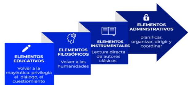
Imagen 4. Elementos educativos, filosóficos, instrumentales y administrativos

Es imprescindible evaluar los elementos educativos, filosóficos, instrumentales y administrativos para generar el sentido humanista, sustentable e innovador en la educación mexicana, como se aprecia en la imagen 4.