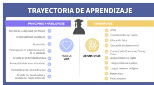
Imagen 2: Trayectoria de aprendizaje

Para una aplicación enfocada en la inclusión y la dignidad humana, el aprendizaje de las asignaturas requiere que los estudiantes desarrollen habilidades para completar su trayectoria de manera integral y para la vida, como se aprecian en la imagen 2 y se describe posteriormente.