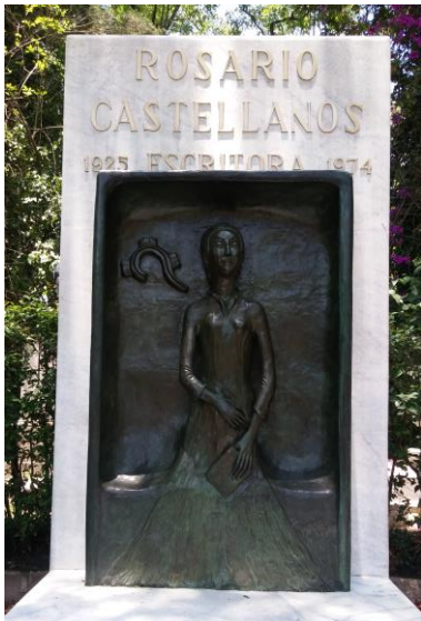
Imagen 3. Tumba de Rosario Castellanos