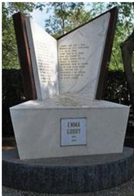
Imagen 7. Tumba de Emma Godoy

Objetos. Elemento arquitectónico. Imitación de una flama. Medias lunas donde se especifican rasgos biográficos. Base redonda.