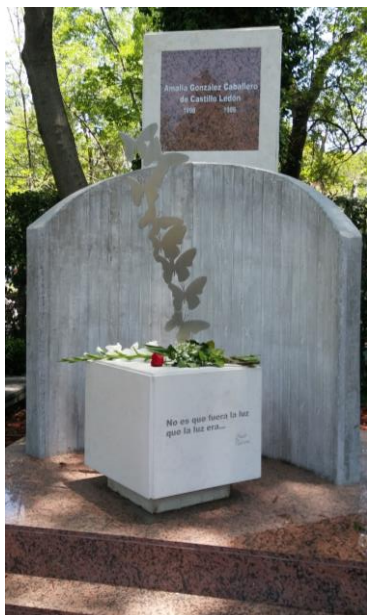
Imagen 8. Tumba de Amalia González Caballero de Ledón