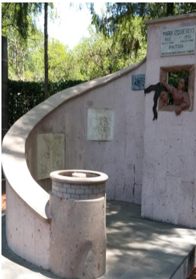
Imagen 4. Tumba de María Izquierdo

Descripción: Tumba base para grupo escultórico.