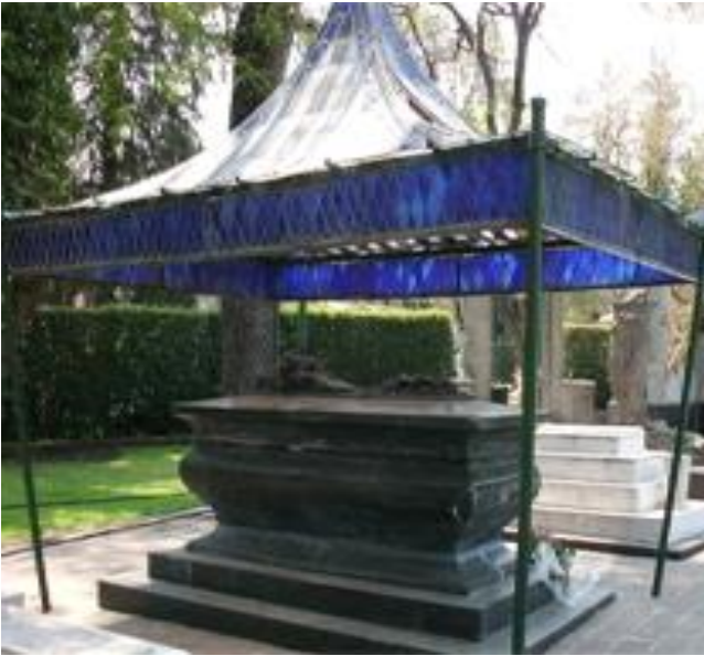
Imagen 2. Tumba de Amado Nervo.