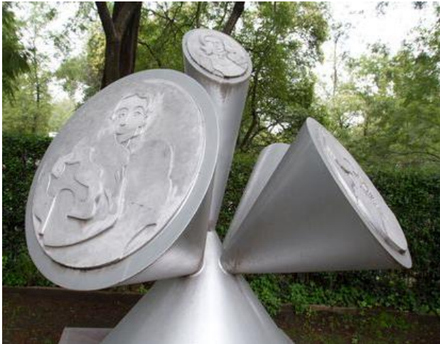
Imagen 5. Tumba de Dolores del Río