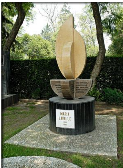
Imagen 6. Tumba de María Lavalle

Objetos. Conos que imitan las luces que iluminan el cielo en los estrenos de cine.