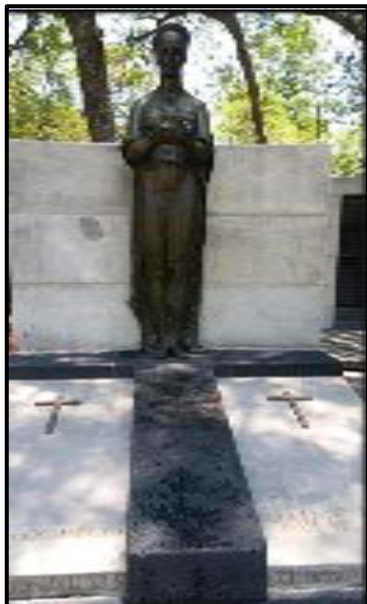
Imagen 7 y 8. Tumba de Francisco González Bocanegra y Jaime Nunó.

Elementos arquitectónicos. Elementos cósmicos. Alegorías filosóficas. Trofeos y emblemas. Flores.