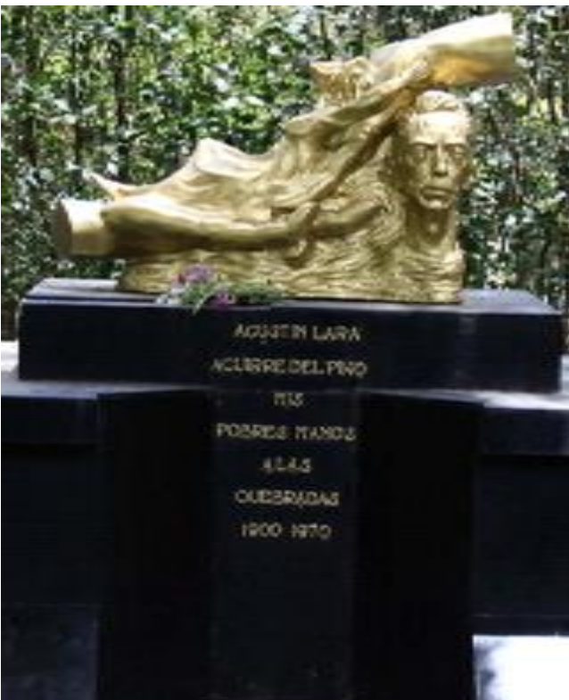
Imagen 3. Tumba de Agustín Lara.

Baldiquino. Representa homenaje único. Se trata de un templete formado por cuatro astas que sostienen un dosel azul, el cual permite que la tumba destaque en cualquier punto del lugar.