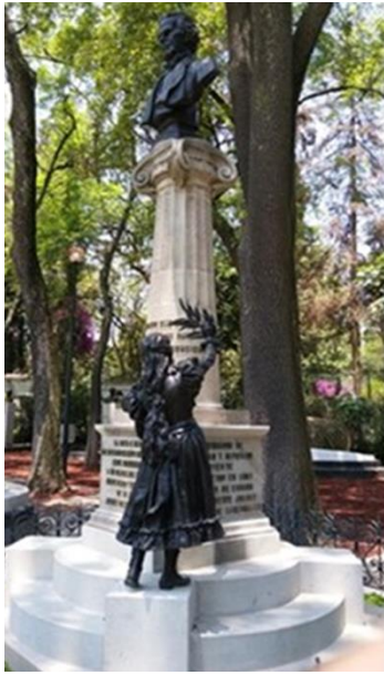
Imagen 4. Tumba de Melchor Ocampo.