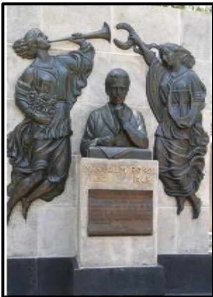
Imagen 5. Tumba de Manuel M. Ponce.