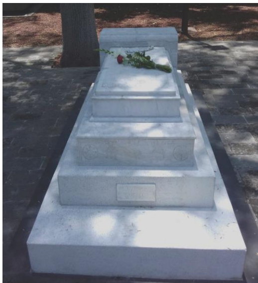
Imagen 1. Tumba de Ángela Peralta