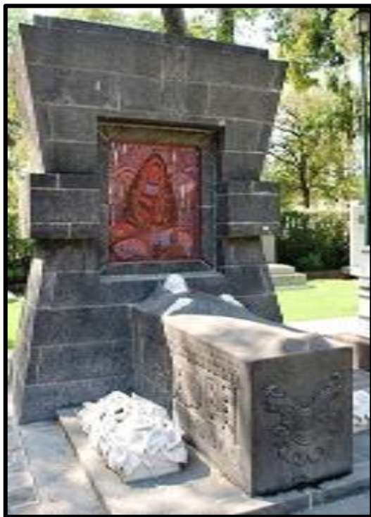
Imagen 6. Tumba de Diego Rivera.