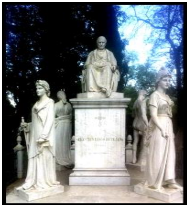
Imagen 1. Tumba de Sebastián Lerdo de Tejada

Las tumbas de ocho hombres elegidos cuyos restos reposan en la Rotonda son las siguientes*: