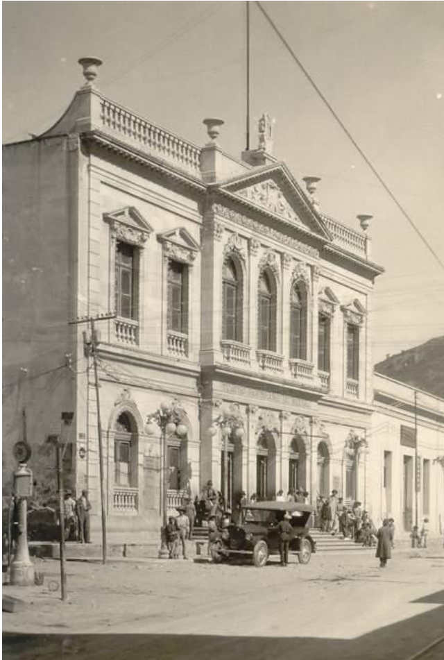
Figura 1. Ejemplo de patrimonio perdido: el Teatro Bartolomé de Medina, derribado en 1943.

México posee un gran Patrimonio Cultural. Éste se puede definir como el acervo de los bienes de la sociedad (que pueden ser tangibles o intangibles), de origen propio o ajeno, que son necesarios para la reproducción social y cultural del pueblo que los sustenta como suyos.