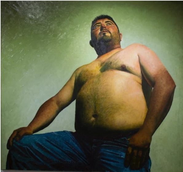
Memo (2017) de Jesús Hernández.

formación política y cultural dentro de la cultura de esta comunidad en Hidalgo.