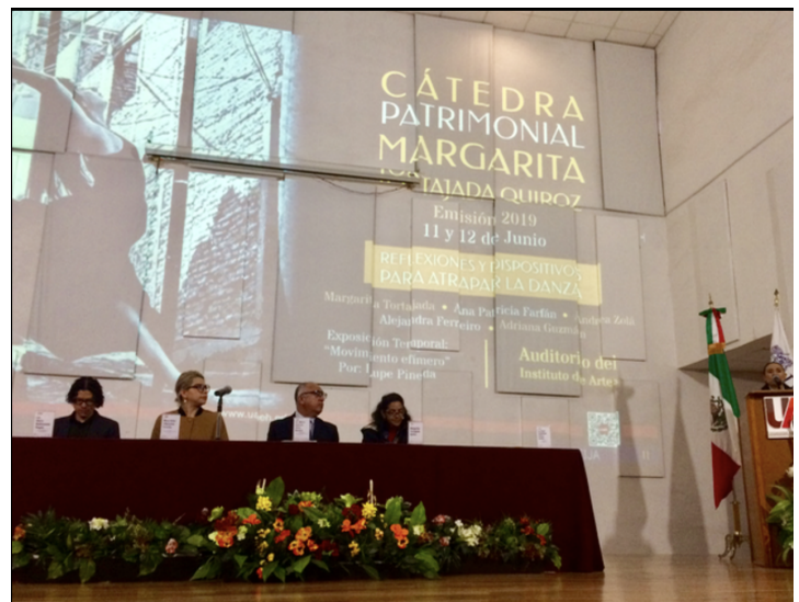
Cátedra Patrimonial Margarita Tortajada, 2019