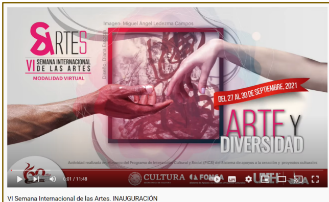
Imagen 1: Presentación de la VI Semana Internacional de las Artes. Canal oficial del Instituto de Artes. Youtube: https://www.youtube.com/watch?v=LMv5oc6Pufo

recurso educativo, creativo y de investigación para la danza; y 4) Nueva escena. Estrategias creativas y tecnológicas bajo un contexto virtual. En este punto es importante señalar que por segundo año consecutivo el simposio fue planteado para realizarse de manera virtual, específicamente con transmisiones pregrabadas o en vivo, a través de las redes sociales y sitios oficiales del Instituto de Artes de la UAEH. Sin duda tras casi dos años de confinamiento, espacios de reflexión aún en la virtualidad se volvieron indispensables. Al cierre de la convocatoria se contabilizaron 76 propuestas de participación, de las cuales se seleccionaron 46 que dieron lugar a las 20 actividades que conformaron el programa final.