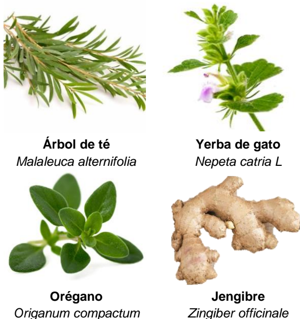
Figura 4. Diferentes especies plantas que han sido empleadas para determinar su capacidad nematocida en parásitos de la familia Anisakidae (Google, 2022).

Algunos componentes como; shogaol y gingerol, compuestos aislados de las raíces de jengibre ( Zingiber officinale ) redujeron el movimiento de espontáneo en las larvas de A. simplex , aproximadamente entre un 80 y 100 % a las 24 y 72 hrs, respectivamente [23]. El aceite esencial de chinchilla ( Tagetes minuta ) demostró que las concentraciones de 5 y 1 %, inactivó el 100% a las 2 hrs de tratamiento, por el contrario, las concentraciones con 0.5 y 0.1 % se alcanzaron a las 4 y 20 hrs, respectivamente [16]. Por otro lado, se realizó un estudio del aceite de hierba buena ( Nepeta cataria ), determinando que las larvas se inactivaron entre las 12 y 18 hrs a las concentraciones de 10 y 5 %, respectivamente [15] ( Figura 4 ). Resulta evidente que el empleo de diferentes tipos de extractos vegetales obtenidos, pueden ser un punto clave para el control de la parasitosis causada por la familia Anisakidae, sin embargo, estos estudios han sido realizados in vitro , lo cual no demerita su capacidad antihelmíntica, pero es necesario llevar a cabo más estudios que permitan probar la efectividad de estos extractos in vivo .