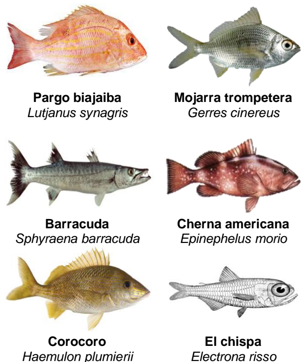
Figura 3. Diferentes especies de peces en las que se han reportado la presencia de nematodos de la familia Anisakidae (Google, 2022).

importancia destaca en su alta digestibilidad, en la presencia de minerales (Fe, I y P) y vitaminas (A, D B1, B2) [25]. Si bien, la presencia de la familia Anisakidae es un problema para el ser humano, es importante destacar que la presencia del parásito en aguas marinas es un proceso natural [4]. Entre las especies de peces marinos, en las que se ha reportado la presencia del parásito, se incluyen: el pez sable ( Aphanopus carbo ), la caballa ( Scomber scombrus ), el jurel ( Alectis alexandrina ), la merluza ( Merluccius spp ), la bacaladilla ( Micromesistius poutassou ), el pargo ( Pagrus pagrus ) y la boga de mar ( Megaleporinus obtusidens ) entre otros ( Figura 3 ) [36]. Pero no solo los pescados marinos pueden quedar parásitos, se ha reportado la parasitosis en peces de agua dulce, debido a que son alimentados con desechos marinos infestados y no tratados. Otras circunstancias como ocurre con el salmón ( Oncorhynchus kisutch ), al tener parte de su ciclo en el mar, puede favorecer a la presencia de la parasitosis [36]. Diversos estudios, como el realizado por Reyes-Rodríguez y colaboradores [32], indican que la presencia del parásito al interior del hospedero paraténico, se localiza principalmente en riñón, hígado, sobre la superficie serosa de las vísceras, vejiga natatoria y en el musculo epiaxial o mejor conocido como filete de pescado