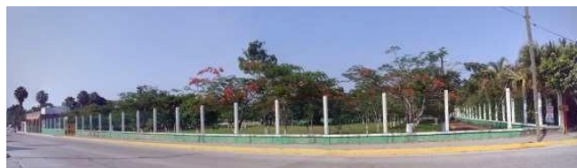
Figura 6. Campo petrolero en desuso adaptado como andador peatonal para los colonos del fraccionamiento Santa Elena.

En Veracruz, las ciudades con orígenes en la industria petrolera, se cuenta con campos petroleros en desuso, algunos de ellos que han sido revitalizados en función del fomento a la convivencia social, el acondicionamiento físico y la recreación infantil, como el que se muestra en la figura 6.