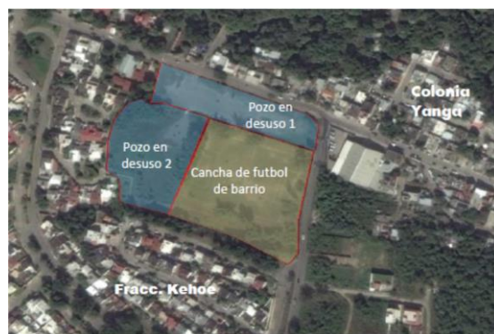
Figura 5. Espacio con posibilidad de intervención urbana, en rescate de campos petroleros en desuso dentro de la ciudad de Poza Rica.

El espacio en desuso y vacío urbano en cuanto a su caracterización se da en el marco de la utilización del espacio público por la población. La valorización de estos espacios marca una constante: su uso futuro. Los posibles escenarios urbanos emergen como puntos factibles de encuentro social. Una de las dificultades para llevar a cabo el presente análisis es lo limitado de la información, la dificultad de concentración y medición de los datos, y con ello elaboración de la tipología de los espacios públicos dentro de la ZMPR. Para ser tomado como referencia tenemos el caso de los campos petroleros que se ubican a un costado de la Avenida Pozo 13 y Nezahualcóyotl, en el fraccionamiento Heriberto Kehoe, que se muestran en la figura 7, y como puede observarse es un punto de interconexión vial dentro de la ciudad de Poza Rica.