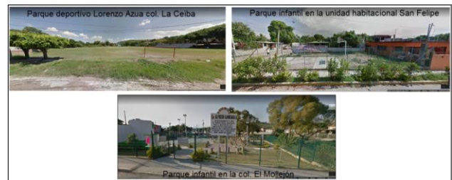
Figura 4. Espacio público tradicional: parques infantiles en colonias de periféricas de ZMPR.

En la figura 4 se observan ejemplos de espacio público tradicional intervenido, en todos los casos se trata de colonias periféricas del municipio de Poza Rica.