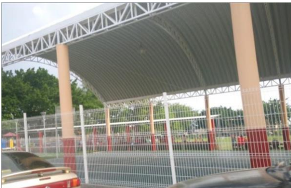
Figura 2. Domo sobre cancha de básquetbol como nuevo espacio público en el parque recreativo de fútbol "Juan Chino" de la col. 27 de septiembre. Marzo 2018

Una ciudad fortalecida, que avanza en su desarrollo se puede conocer a través de sus espacios públicos, si estos son confortables, seguros, conectados con las vialidades así puede interpretarse como una trama urbana competitiva. En la Agenda 2025 para el espacio público y la vida pública en México se declara que el espacio público es el activo más valioso con el que cuenta la ciudad para contribuir a su desarrollo estratégico considerando que más del 72% de la poblacional nacional habita en ciudades (Asociación Nacional de Parques y Recreación y WRI México, 2018), en lo cual concordamos debido a que el estudio se concentra en la generación del nuevo espacio público, y con ello, en su revalorización sin precedentes favorables a causa de la visión de habitabilidad y competitividad al tomar en consideración los beneficios en la mejora de la salud emocional, física y mental del usuario promoviéndose un efecto secundario en la mejor de la calidad visual, ambiental y del entorno urbano. En casos nacionales se pueden observar casos de peatonalización de calles donde el comercio local se ha beneficiado por la mayor visita a sus comercios.