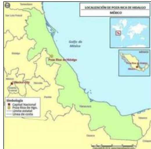
Figura 1. Ubicación de la ciudad de Poza Rica, Veracruz.

urbana (DMU) de cada municipio se obtuvo a partir de la densidad bruta (población entre superficie) de cada una de sus AGEB urbanas ponderadas por el tamaño de su población como se muestra en la tabla 1. Para el cálculo de la densidad media urbana se tomó la fórmula planteada por el INEGI. (SEDESOL, 2004).