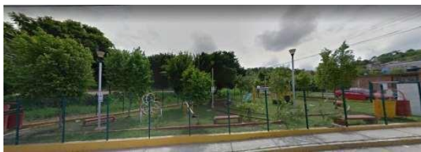
Figura 5. Espacio público ganado a través de un espacio residual en la colonia Arboledas.

El objetivo estratégico de la recuperación de espacios residuales es claramente referente a la salud: vigorizar y consolidar la creación de nuevos espacios públicos recreativos y deportivos para el combate al sedentarismo, inherente a este surge un segundo objetivo a mediano plazo como lo es el fortalecimiento a la seguridad, separando a la juventud de la ociosidad y proveyéndola de espacios aptos para su esparcimiento. La crisis ecológica, escalado a cada una de las urbes, se manifiesta en la crisis de espacios destinados a la recreación, deporte, cultura donde no se considera a la naturaleza como recurso sino como un bien factible de explotación urbana, para nuestro caso. Como señala Carrasco, la naturaleza es parte constitutiva de la sociedad, y por tanto, no es independiente ni objeto vendible (Carrasco, 2014). La fragmentación de las inversiones, la carencia de un plan maestro, la minimización de los beneficios disminuye la visualización de las administraciones que si invierten sus esfuerzos en la dignificación del nuevo espacio público.