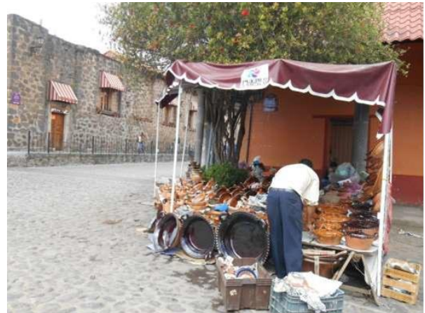
Figura 5: Calle principal del pueblo en la cual un artesano local exhibe su mercancía artesanal, el toldo del puesto ostenta el logotipo del PPM (Benavides M. 2016).

sensorial que conlleva la actividad contribuye a la valoración de esta artesanía representativa del pueblo.