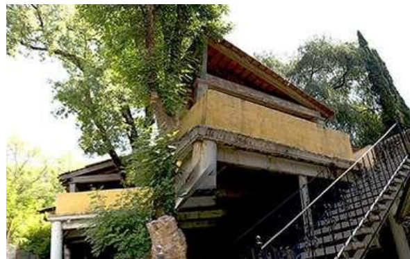
Figura 3: Vista de la parte superior de la terraza construida sobre el río (Bigurra C. 2018).

Algunos dueños de casas del pueblo ante la expectativa que conlleva el que este fuera promovido turísticamente desde el ámbito federal y el deseo de contar con un mejor posicionamiento o una posibilidad de convertirse en prestadores de servicios turísticos, en algunos casos remodelaron o reconstruyeron sus casas, de un piso a dos niveles con diseño contemporáneo. Desafortunadamente otros derribaron su propiedad total o parcialmente y construyeron con nuevas tipologías. Ante lo sucedido el municipio intervino estableciendo el Reglamento para la Protección y Conservación del Centro Histórico con el fin de preservar el patrimonio construido y promoviendo que las edificaciones reciban mantenimiento de forma cíclica.