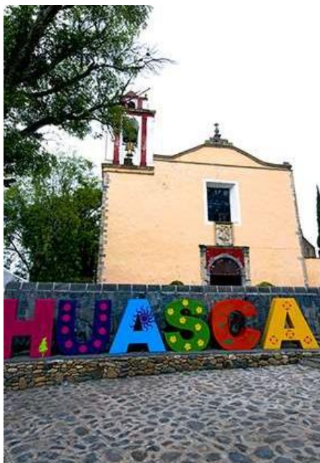
Figura 2: El centro de Huasca adornado con el nombre del Pueblo Mágico. Al fondo se aprecia la Iglesia de San Juan Bautista (Bigurra C. 2018).

publicó un decreto que es el Reglamento para la Protección y Conservación del Centro Histórico: En este reconoce que para tal efecto es necesario que se efectúe el rescate y mantenimiento de este como de las iglesias y haciendas que conforman el patrimonio municipal. En el documento se estableció que el cumplimiento de este no se haga bajo una orientación negativa, sino más bien orientadora y preventiva.