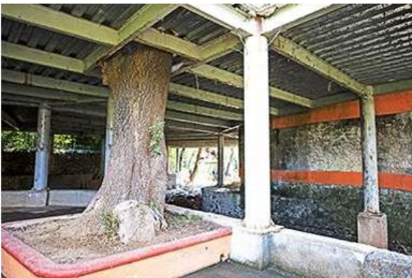
Figura 4: Vista inferior de la terraza, columnas y arriates, en el lecho del río (Bigurra C. 2016).

imagen urbana del espacio público, del jardín frente a la iglesia y la explanada de los arcos por medio de reubicar el comercio ambulante de las áreas mencionadas en la nueva edificación.