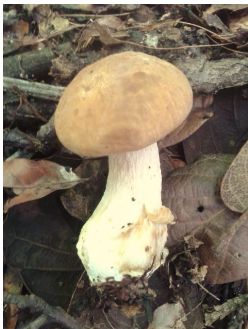
Figura 3: Boletus edulis . Fotografía tomada en Acaxochitlán hidalgo, por Alethia de Lucio-Flores.