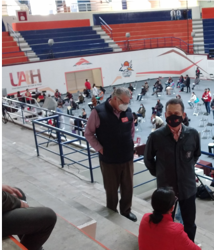
Figura 1: Campaña de vacunación en la Universidad Autónoma del Estado de Hidalgo. Mayo de 2021.

El avance en el porcentaje de vacunación en la población, y la creciente necesidad de reactivar la economía, empujan hacia la reapertura de muchas actividades sociales, como la educación.