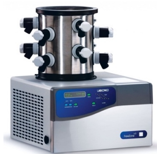
Figura 5. Liofilizador LABCONCO 4.5L.

La LI es uno de los métodos de encapsulación más empleados, debido a su simplicidad (Pudziulyte et al., 2020). Este proceso se basa en la sublimación de una muestra congelada, en tres etapas continuas: congelación, secado primario o sublimación y secado secundario o desorción (Fang & Bhandari, 2012). Este proceso es adecuado para compuestos sensibles a las altas temperaturas como nutraceuticos e ingredientes alimentarios, debido a que son protegidos en materiales pared como disacáridos, gomas y maltodextrinas (Fang & Bhandari, 2012; Pudziulyte et al., 2020). En la Figura 5 se muestra un liofilizador de laboratorio.