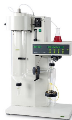
Figura 6. Secador por aspersión BÜCHI B-290. Tomada de BÜCHI (2022).

El SA es un proceso continuo, simple, económico y con alto rendimiento, que produce polvos de calidad (Nedovic et al., 2011; Đorđević et al., 2015). Este proceso se ejecuta en cuatro etapas consecutivas: atomización, contacto aire-gota, evaporación y recolección (Díaz-Montes et al., 2021). Las condiciones operativas de un secador por aspersión como, la presión de atomización, flujo de alimentación, temperatura de entrada y velocidad de aspiración son responsables de producir encapsulados con diversas características (p. Ej., morfología, tamaño de partícula, humedad, cristalinidad y retención de compuestos) (Anandharamakrishnan & Padma, 2015; Ohtake et al., 2020). Comercialmente se encuentran equipos de secado por aspersión de diferentes escalas y características (Díaz-Montes et al., 2022), en la Figura 6 se ilustra un equipo a escala laboratorio.