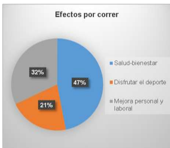
Grafico 1. Efectos que experimentan al correr.