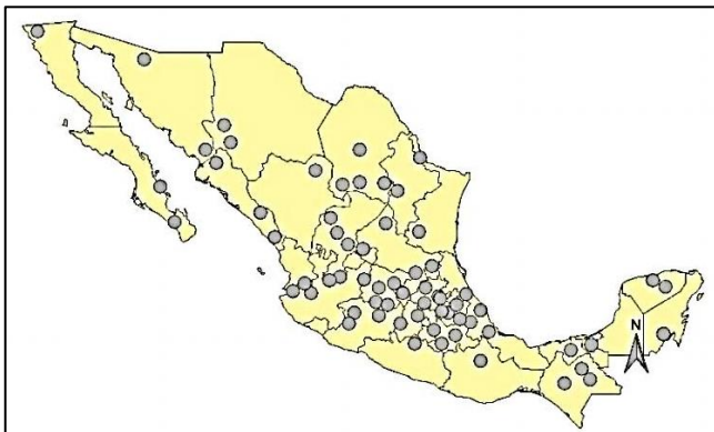
Figura 2. Pueblos Mágicos en México

Los pueblos mágicos en México, de no ser en la zona central del país, se encuentran más lejanos unos de otros, lo cual les puede dar más autonomía pero también menos ayuda que en el caso francés. En México se trata de un programa de origen oficial, con financiamiento público y que, lamentablemente, ha venido beneficiando mayormente a los dueños del capital privado.