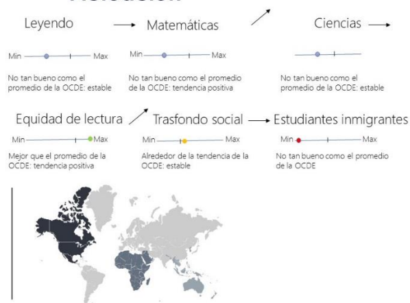
Ilustración 2. Áreas temáticas principales de PISA Actuación

Muestra el resumen de desafíos que el país enfrenta (OCDE 2017)