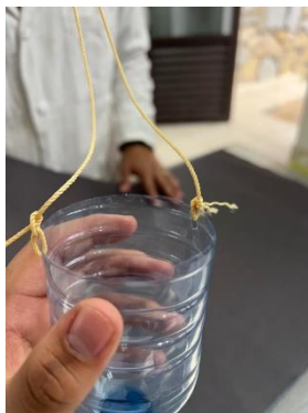
Imagen 2: péndulo funcionando

Se comprobará si estos resultados son correctos en el software.