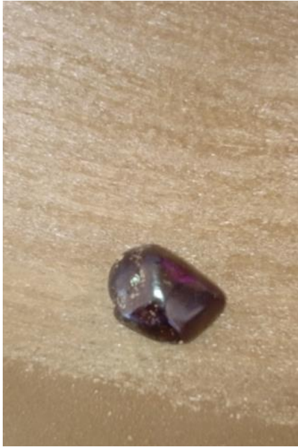
Imagen 9.2 Piedra para alizar