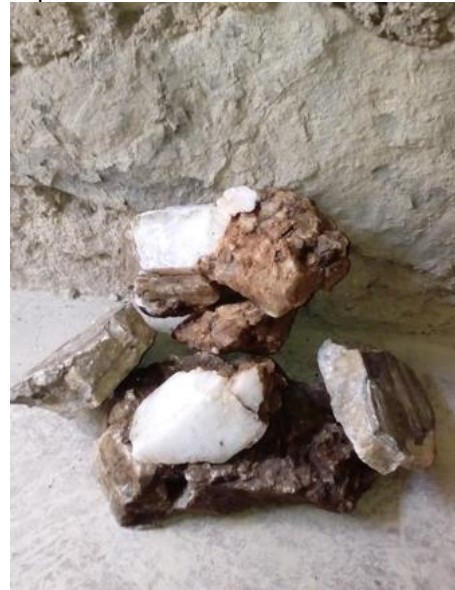
Imagen 1 Chililite