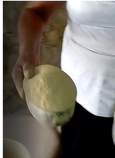
Imagen 4 Barro molido

3- Ambos se revuelven y con agua se hace un proceso de mezcla formando una pasta en una consistencia suave.