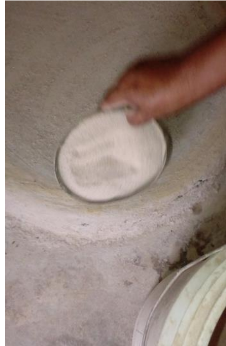
Imagen 3 Chillite molido