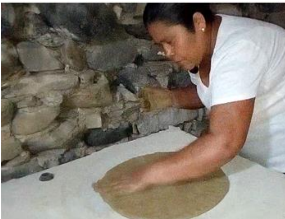
Imagen 8 Molde del comal

5- Posteriormente se debe destender justo al tamaño del molde