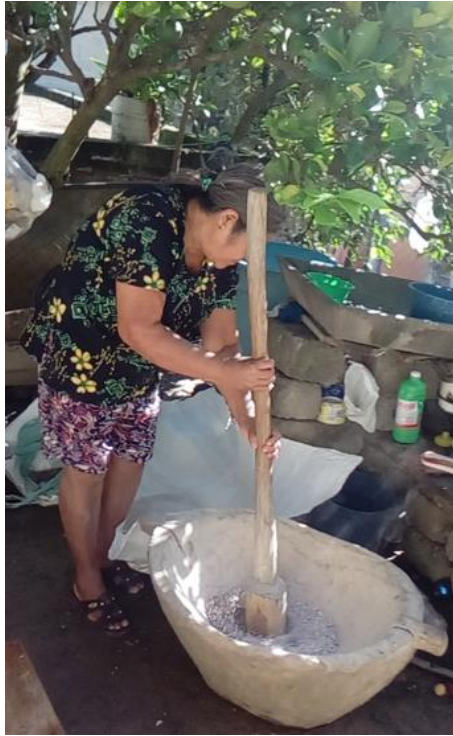
Imagen 2.1 Mortero