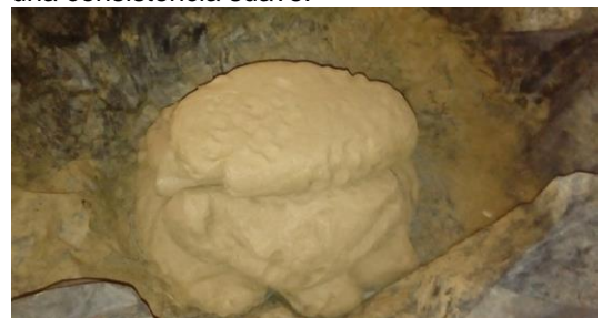
Imagen 5 Mezcla de Barro y Chillite

3- Ambos se revuelven y con agua se hace un proceso de mezcla formando una pasta en una consistencia suave.