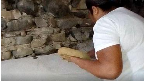
Imagen 6 Molde 1

4- Una vez hecha la mezcla, se amasa lo mejor que se pueda, para proceder en distenderla en unos moldes.