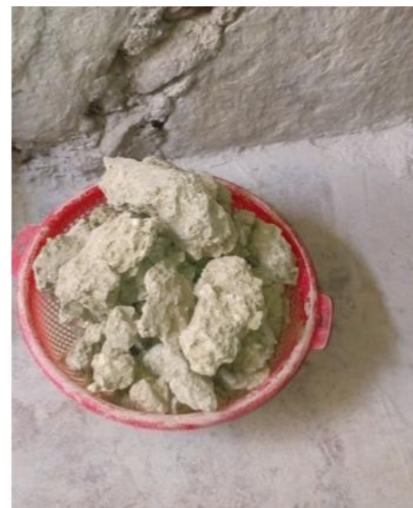
Imagen 2 barro