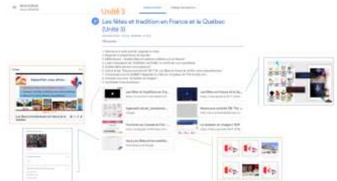
Figura 6. Ejemplo de tareas asignadas.

Posteriormente, se otorgó un puntaje a la tarea y aunque existe la posibilidad de establecer la fecha de entrega, no se le impuso una fecha límite. Por último se guardó la tarea y quedó asignada. De esa misma forma, se fueron estableciendo todas las actividades en cada una de las unidades. En la figura 6 se presenta un ejemplo de tareas asignadas en Google Classroom .