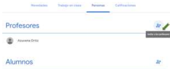
Figura 9. Invitación a profesores.

La plataforma Google Classroom permite integrar profesores como se visualiza en la figura 9.