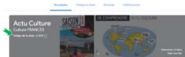
Figura 4. Página principal de la plataforma Actu culture en Google Classroom

Al momento de crear la clase, en automático se le asigna un código que fungirá como clave de acceso al aula virtual, como se ilustra en la figura 4; los alumnos también podrán acceder a ella enviándoles el enlace vía correo electrónico.