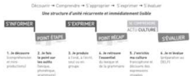
Figura 1. Estructura las unidades en Saison 1 (Cocton, 2015).

Las unidades de aprendizaje están distribuidas en tres módulos, conformados cada uno por tres unidades de aprendizaje. Cada unidad se encuentra estructurada por etapas como se muestra en la figura 1.