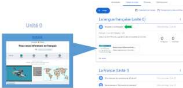
Figura 8. Anexo de la unidad 0

Igualmente, se proyecta invitar a los profesores de FLE del CEI de la UQroo a participar en esta aula virtual para trabajar de manera colaborativa, asignándoles un rol de administradores. En el marco de un trabajo colaborativo, los docentes contribuirían a la mejora del espacio de aprendizaje en línea, analizando el material existente, proponiendo modificaciones a lo existente y/o diseñando actividades complementarias, a la par de dar acompañamiento a los alumnos, que serán integrados a la plataforma al inicio de cada periodo escolar.