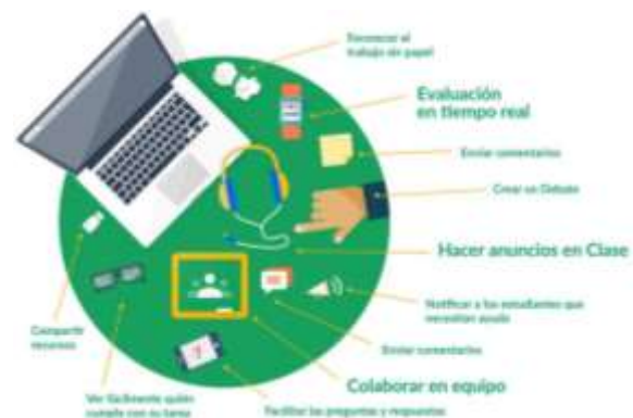
Figura 3. Ventajas de un aula virtual con google Classroom http://elearningmasters.galileo.edu/2017/03/20/aula-virtual-con-google-classroom/

Las diversas ventajas que ofrece a los profesores el aula virtual de Google Classroom se ilustran en la figura 3.