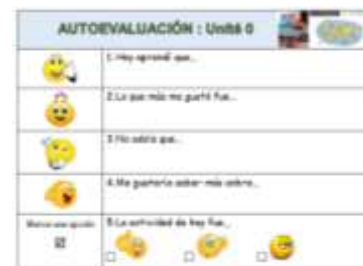
Figura 7. Ficha de Autoevaluación

La autoevaluación se encontrará disponible en la plataforma y se prevee también contar con un formato online para hacerla más versátil. En la figura 7 se puede ver un ejemplo de la ficha de autoevaluación.