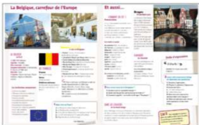
Figura 2. Sección Actu culture , unidad 6, Saison 1 . (Cocton 2015).

A manera de ilustración del contenido de la sección Actu culture , en la unidad seis, la temática cultural se centra en Bélgica. Por un lado se presentan algunos datos puntuales sobre Bélgica, también se enlistan las instituciones europeas con sede en ese país, así como los museos más representativos. Por otro lado, se da una pequeña lista de palabras en francés con variación lingüística y un pequeño apartado hace alusión a los cambios en la pronunciación de ciertos sonidos. Igualmente se hace mención de la ciudad de Brujas y se destaca la fama del chocolate como especialidad gastronómica. En este apartado también se hace alusión a una expresión idiomática belga y se proponen dos mini tests de comprensión de la información proporcionada. Ver figura 2.