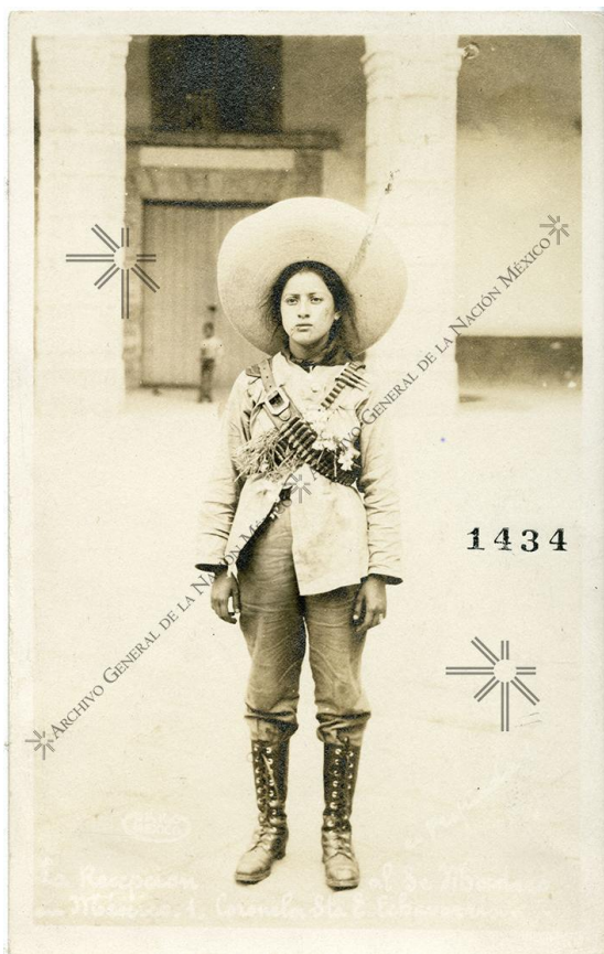
Figura 1. Petra Herrera. Archivo General de la Nación [3]. Conocida también como Pedro Herrera, se autodenominó "General", formó un ejército de mujeres que apoyó a los maderistas durante el asalto a la ciudad de Torreón, Coahuila; en este acontecimiento se logró la expulsión de fuerzas federales

desafíos y dificultades que las mujeres han enfrentado desde siempre: la desigualdad de género, el poco o nulo acceso a educación, servicios médicos adecuados, libertades fundamentales, o derechos considerados humanos que, en dicha época no eran reconocidos para aquellas quienes fueron y siguen siendo un pilar fundamental de la sociedad y, por ende, un eje de desarrollo en cualquier comunidad. [1] A raíz de los estereotipos de la época, estas mujeres tuvieron que adaptarse a un entorno hostil, en el cual, de acuerdo a Hernández y Lazo [2] la debilidad era asociada a la figura femenina, y repudiada por no aportar a la causa; tuvieron que aprender a empuñar armas y montar caballos bajo las miradas críticas de una sociedad conservadora, que empleó a su favor la lucha de las mujeres, para desconocer posteriormente su participación y aportaciones a un movimiento que requirió de todo lo humanamente posible para lograr su cometido.