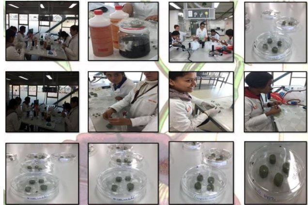
Figura 1. Cajas petri con tratamientos de pastillas de maíz con extractos de I. stans . Fotografías tomadas en el laboratorio de química de la Escuela Preparatoria Número 1.

Para determinar la actividad insecticida de los extractos etanólicos de I. stans se realizaron 2 experimentos con 3 réplicas de las partes separadas de la planta, cada una con concentraciones de 1600 µg/ml y 3400 µg/ml. En cada caja petri se colocó 4 pastillas de maíz para hoja, flor, tallo, raíz, así como un control positivo y un control negativo. El control positivo estaba impregnado por un insecticida comercial que contiene isobutano, propano, d-frenotina, praletrina y agua, mientras, que el control negativo solo estaba impregnado por 1 ml de etanol. Las pastillas de maíz con cada una de sus tratamientos se dejaron 30 minutos en temperatura ambiente para evaporar el exceso de etanol. (Figura 1). Posteriormente se colocaron tres gorgojos en cada caja de los tratamientos y se observaron durante 2 horas.