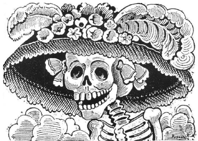
Figure 4. La Garbancera. José Guadalupe Posada https://www.mexicodesconocido.com.mx/jose-guadalupe-posada.html

Posteriormente la imagen fue llamada La Catrina por el muralista Diego Rivera.7