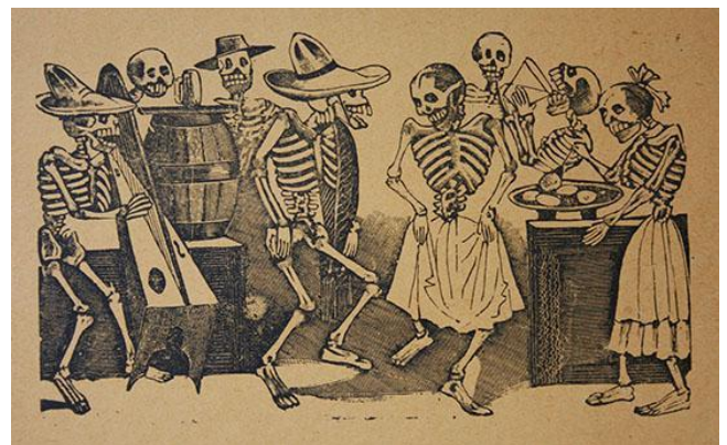
Figure 5. El jarabe de ultratumba. José Guadalupe Posada. Extraído de: http://museoblaisten.com/Obra/7242/El-jarabe-en-ultra-tumba