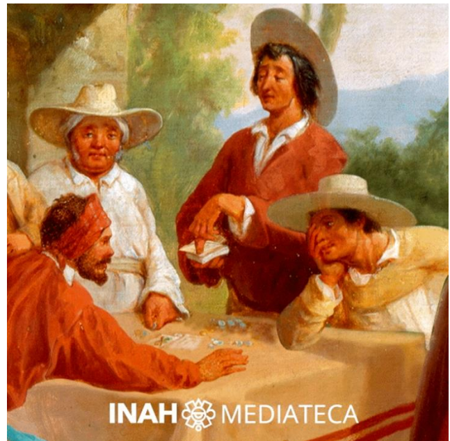
Figure 1. Truanes en una venta . 2018.

Refleja los usos y costumbres sociales, sin analizarlos ni interpretarlos críticamente