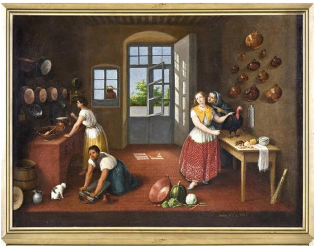
Figure 2. La cocina poblana. José Agustín Arrieta. 1863. Museo Nacional de Historia Casrillo de Chapultepec. https://artesdemexico.com/el-mole-de-leonora/