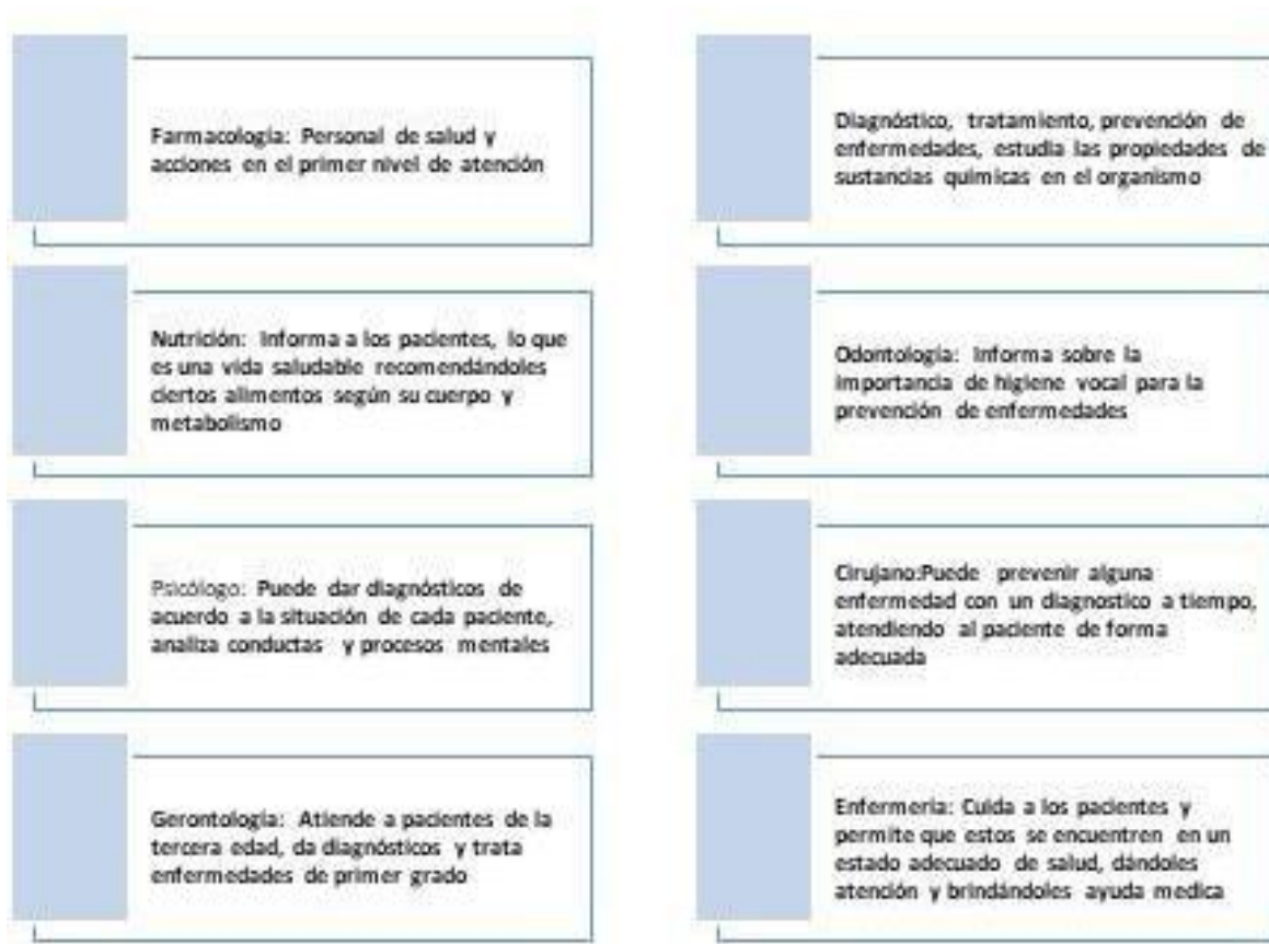
Figure 2. Áreas de Salud. Imagen propia realizada en Smart Art 2023.